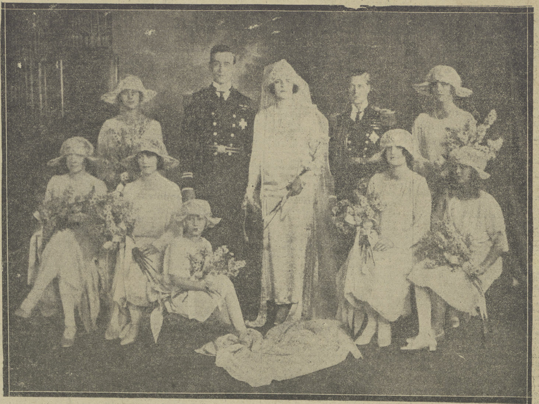
Lord Luis Mounbatten, primo de la Reina de España, y su esposa, mis Edvina Ashley, con su corte de honor, en la que figuran tres princesas griegas. En la fotografía aparece también el príncipe de Gales.

—Un día que cruzábamos la calle, un ómnibus nos alcanzó; derribó el cochecillo. No tuvo tiempo de contener a mi mujer. Había muerto el hijo; pero quedaba la fibra, la fibra heroica que hace sublimes a las leonas y a las gallinas, la suprema sensualidad maternal que han dejado entera en las mujeres, lo mismo que en las bestias. Mi mujer se arrojó bajo las ruedas para salvar a su falso hijo... Murió del golpe.