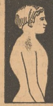
MAL DE POTT