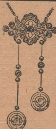
Núm. 5: Pendientif 11 brillantes y diamantes. Pesetas 975