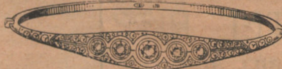
Núm. 7: Pulsera 5 brillantes y diamantes. Pesetas 900.