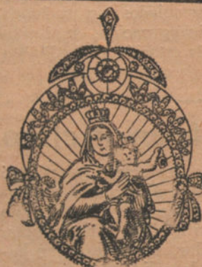
Núm. 3: Medalla 6 brillantes y diamantes. Pesetas 600.