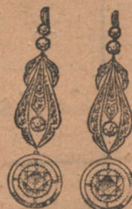
Núm. 4: Pendientes 8 brillantes y diamantes. Pesetas 1.100