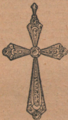
Núm. 1: Cruz 5 brillantes y diamantes. Pesetas 575

MONTADOS SOBRE PLATINO FINO Y ORO DE LEY DE 18 quilates, CONTRASTADO