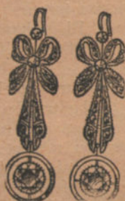
Núm. 2: Pendientes 6 brillantes y diamantes. Pesetas 975