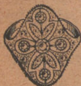
Número 6: Sortija 5 brillantes y diamantes. Pesetas 325