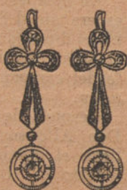
Núm. 2: Pendientes 6 brillantes y diamantes. Pesetas 475