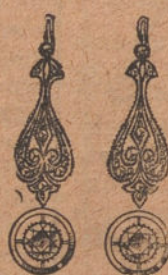
Núm. 4: Pendientes 4 brillantes y diamantes. Pesetas 575