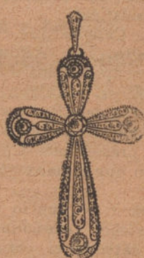
Núm. 5: Cruz 5 brillantes y diamantes. Pesetas 450