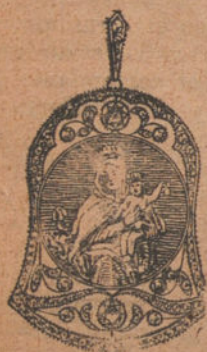
Núm. 1: Medalla 8 brillantes y diamantes Pesetas 400

Brillantes de primera calidad. Diamantes rosas Montados sobre platino fino y oro e ley 18 de Holanda quilates, contrastado