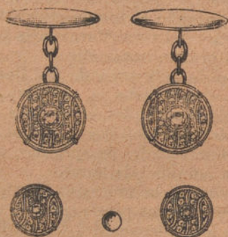
Número 3: Botonadura 4 brillantes y diamantes. Pesetas 475