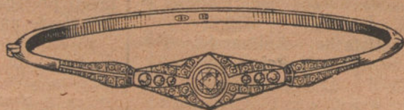
Núm. 7: Pulsera 7 brillantes y diamantes. Pesetas 550