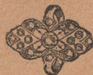
Número. 8: Sortija 7 brillantes y diamantes. Pesetas 375.

Factura de garantía en todas las compras