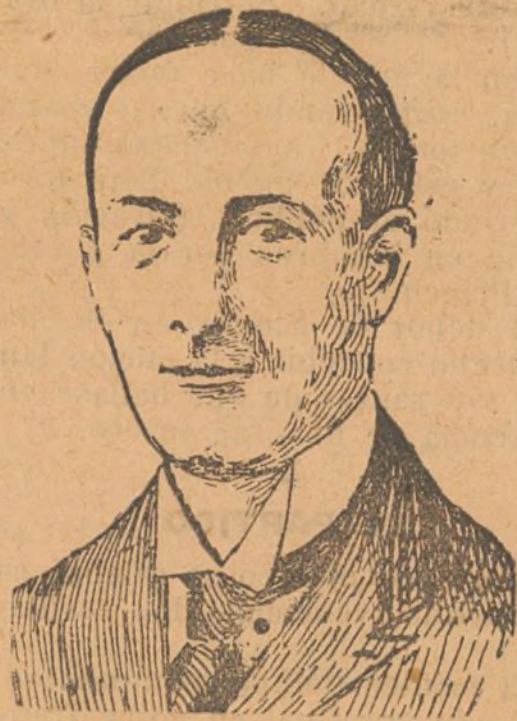
Staley Baldwin presidente del Gobierno inglés que presentó la dimisión al rey Jorge, a consecuencia de la derrota electoral