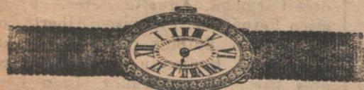
Núm. 3.—Ovalado de platino y oro de 18 quilates con brillantes. Ptas. 600