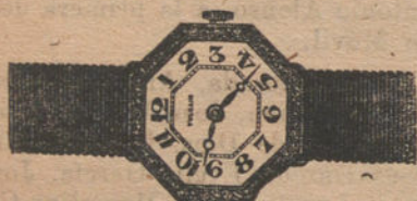
Núm. 1.—Octógono de platino y oro de ley 18 quilates, con diamantes rosas. Ptas. 500