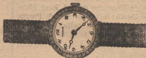
Núm. 2.—Reloj de platino y oro ley 18 quilates, con diamantes rosas. Ptas. 550