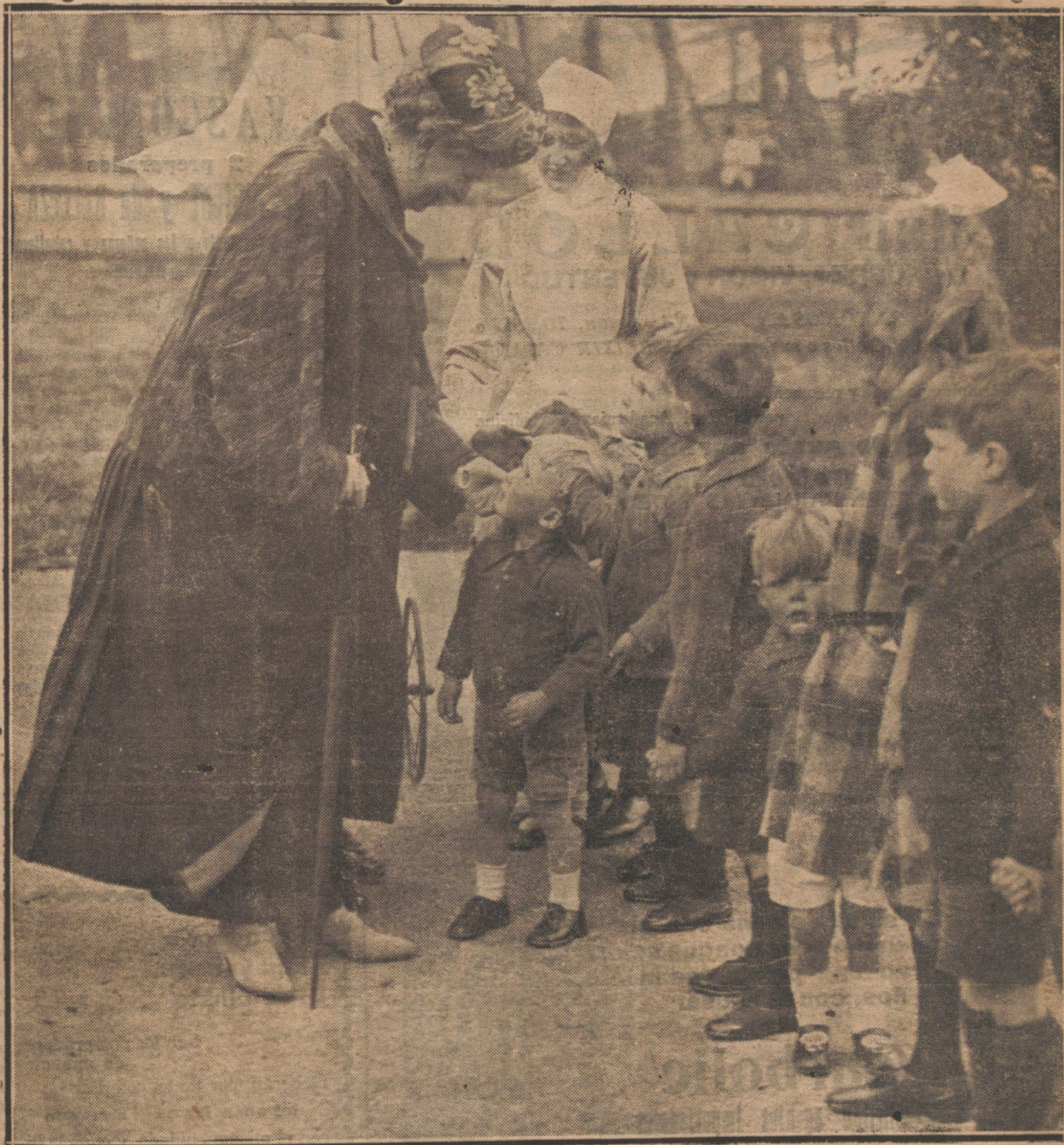
NOTAS GRÁFICAS DE ACTUALIDAD LA REINA DE INGLATERRA VISITANDO UN COLEGIO DE HUERFANOS DE LA GUERRA