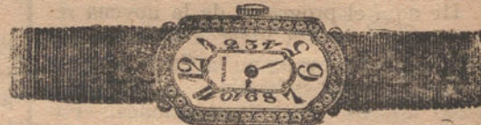
Núm. 5.—Reloj de platino y oro ley 18 quilates, con brillantes. Ptas. 750

FACTURA DE GARANTIA EN TODAS LAS COMPRAS