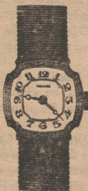
Núm. 4.—Platino y oro ley 18 quilates, con diamantes rosas. Ptas. 450