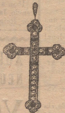
Núm. 12: Cruz 26 brillantes, diamantes y zafiros. Pesetas 450.