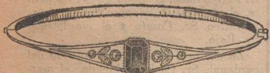
Núm. 2: Pulsera 4 brillantes, diamantes y zafiro Pesetas 300