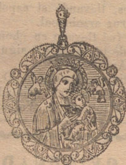
Núm. 8: Medalla 4 brillantes y zafiros Pesetas 375