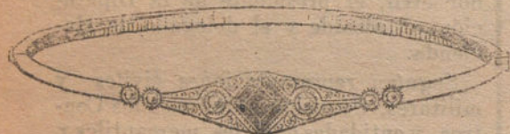
Núm. 3: Pulsera 6 brillantes, diamantes y zafiro Pesetas 350