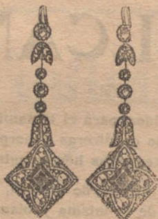
Núm. 9: Pendientes 8 brillantes, diamantes y zafiros Pesetas 500