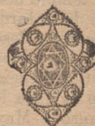
Núm. 14: Sortija 4 brillantes, diamantes y zafiros Pesetas 350