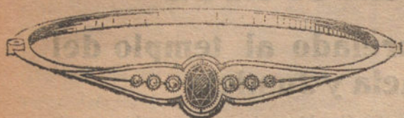
Núm. 1: Pulsera 6 brillantes y zafiro Pesetas 275

CON BRILLANTES DE PRIMERA CALIDAD. DIAMANTES ROSAS DE HOLANDA. ZAFIROS FINOS. MONURAS DE PLATINO Y ORO DE LEY 18 QUILATES CONTRASTADO