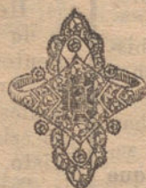
Núm. 11: Sortija 6 brillantes, diamantes y zafiro. Pesetas 300