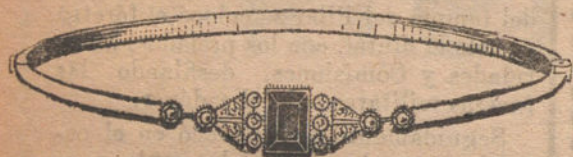
Núm. 4: Pulsera 10 brillantes, diamantes y zafiro Pesetas 400