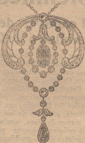
Núm. 7: Pendentif 32 brillantes, diamantes y zafiros Pesetas 925