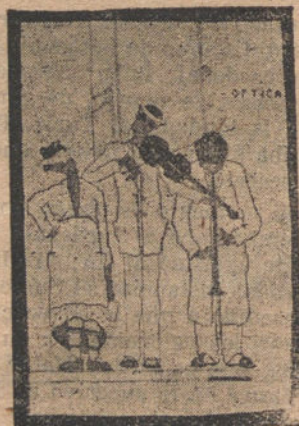
Hay que ver...!

pl1stica realidad que nos ofrecen cotidianos espect1culos del arroyo y de los arrabales madrile1os.