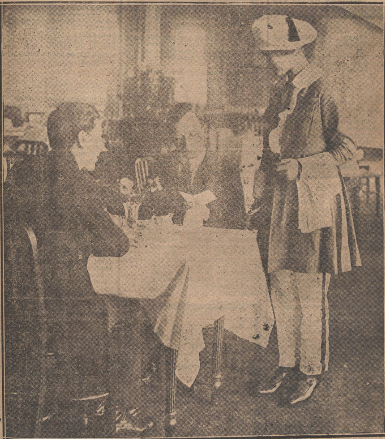
NOTAS GRAFICAS DE ACTUALIDAD.—Nuevo modelo de trajes de camareras en Londres