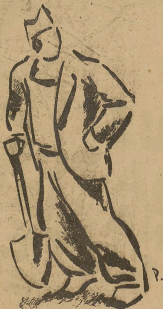
Del natural, por Puyol.

te entonces, ofrece hoy fuerzas con una disciplina férrea, con una confianza grande hacia sus mandos, confianza nacida de la elección democrática. Porque el heroísmo no basta; se precisa para completar los factores de victoria y organización.