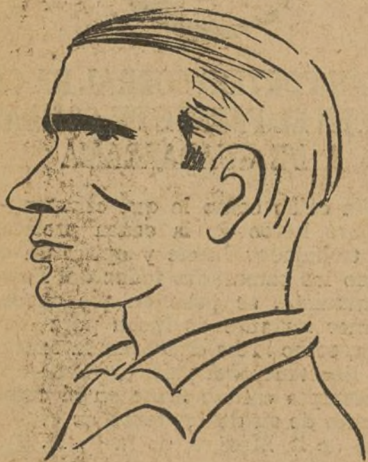
EL COMANDANTE ENRIQUE LISTER

Una de las figuras surgidas de la heroica lucha que está riñendo el pueblo español con el fascismo internacional es la del comandante de Milicias Enrique Lister, que ha tenido una brillantísima actuación en el frente de Guadarrama. Lister es un hijo del pueblo, del auténtico pueblo español, que está asombrando al mundo con su valerosa rebeldía. Desde 1931 milita en el Partido Comunista activamente y actúa como presidente del Sindicato Sociedad de Piedra y Mármol, pues su profesión es obrero cantero. A conse-