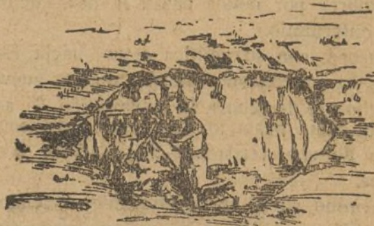
APROVECHAMIENTO DEL TERRENO

Una mesa, adosada a un muro. La aspillera abierta en éste se cubre con un escudo metálico y sacos terreros. En los poblados se obtendrán buenos asentamientos de armas automáticas, en las cubiertas de las casas, quitando una teja. Se aprovecharán lugares dominantes y que el enemigo no pueda sospechar siquiera, para obtener el efecto "instantáneo" y por "sorpresa" de estas armas.