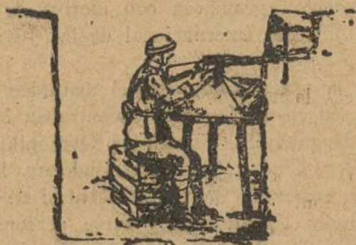
APROVECHAMIENTO DEL TERRENO

Esta responsabilidad puede llegar a ser un encubrimiento y hasta una traición, y entonces hay que emplear con ellos la justicia de guerra.