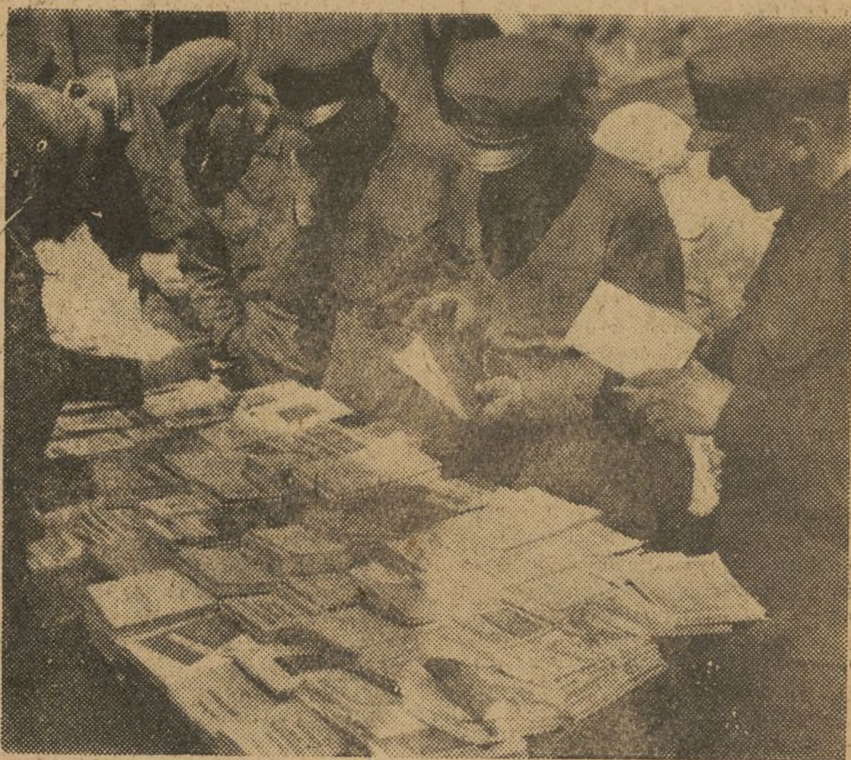
LOS SOLDADOS ROJOS ESCOGIENDO LIBROS EN EL PUESTO DE UN CAMPAMENTO