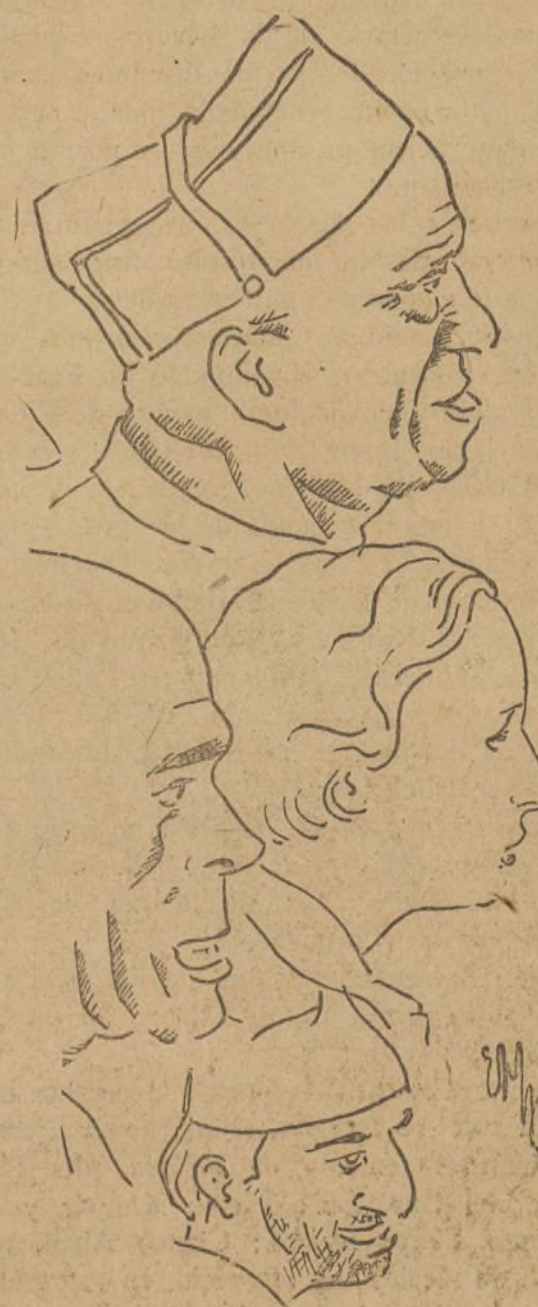
Oradores que tomaron parte en el acto