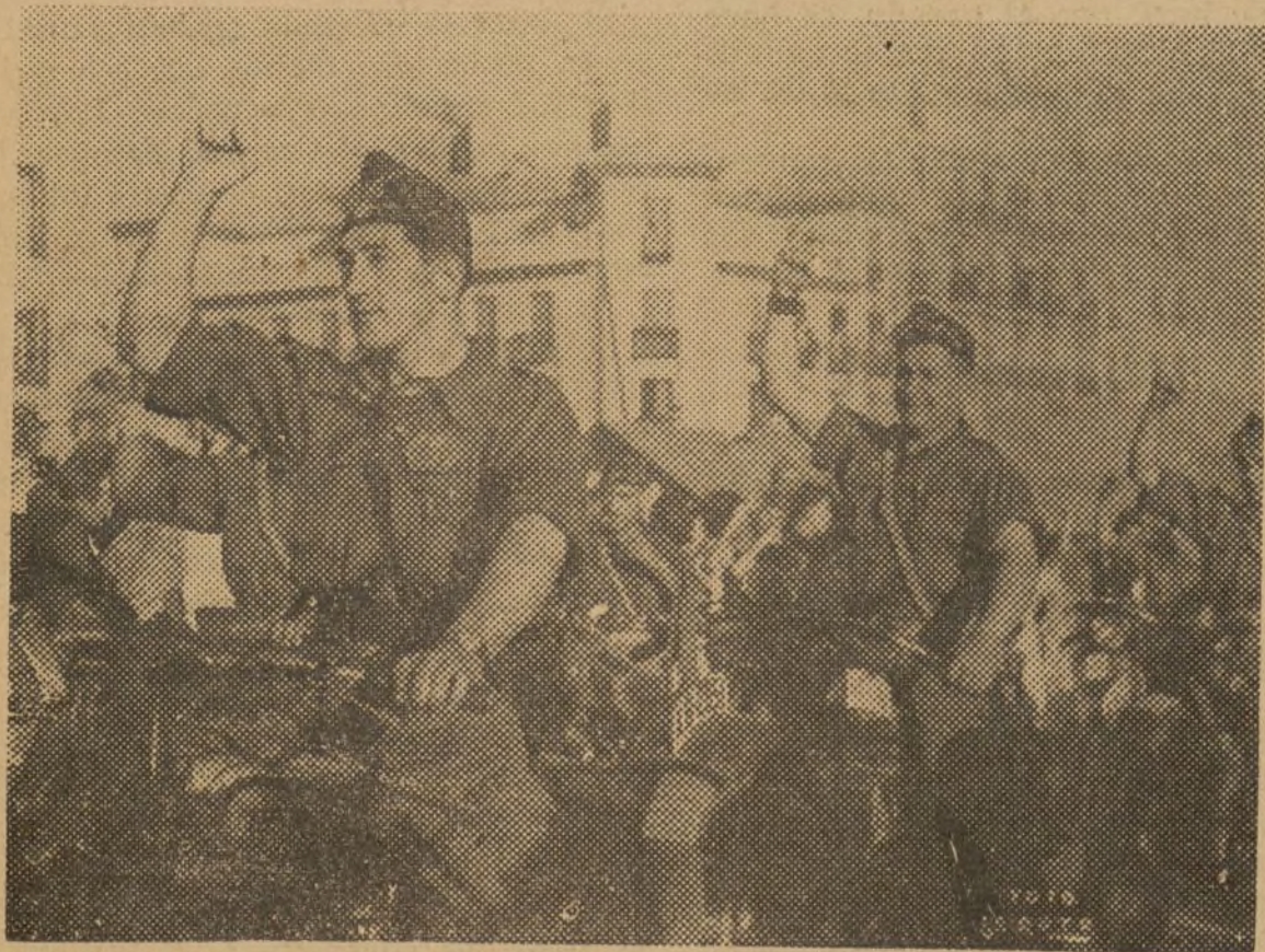
La Motorizada del 5.º Regimiento, desfilando

A las cinco y veinte comenzó el acto, desfilando ante el estrado presidencial y en presencia del comandante Carlos y de todas las representaciones, que después enumeraremos, la bandera del Partido Comunista italiano, conducida por uno de los delega-