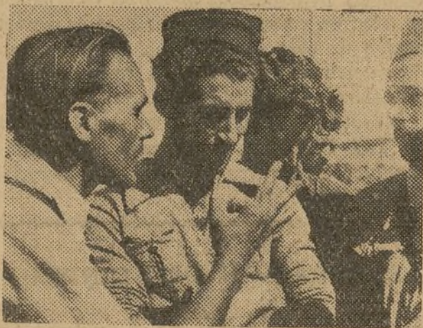
El comandante-jefe del 5.º Regimiento, Enrique Lister, dando instrucciones en el campo de batalla

Pero no sólo a esto se ha limitado la banda del 5.º Regimiento; el maestro Oropesa, con los compañeros músicos que componen la banda, han estado en casi todos los frentes, donde van muy a menudo a hacer oír a los milicianos, en el mismo sitio donde se batían, los himnos revolucionarios, para que los sirvan de estímulo. No es necesario decir la alegría con que son acogidos. Sería