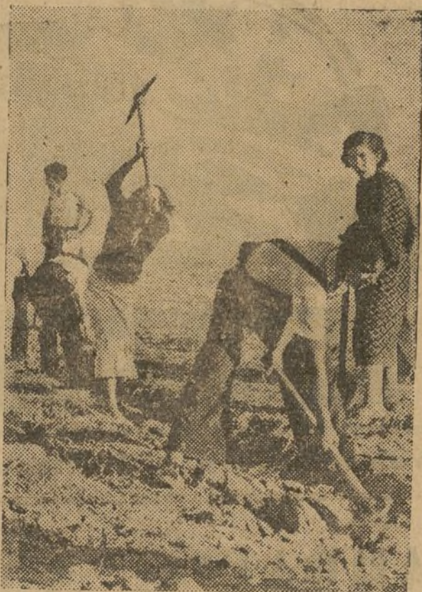
LA FORTIFICACION DE MADRID Hombres y mujeres compiten en la labor de hacer a Madrid inexpugnable

El 5.º Regimiento os dice: "Nosotros, 5.º Regimiento, como 5.º Regimiento tomamos el puesto de mayor peligro. En el frente y en Madrid. Así serviremos los intereses de nuestro país y de nuestro Gobierno del Frente Popular."