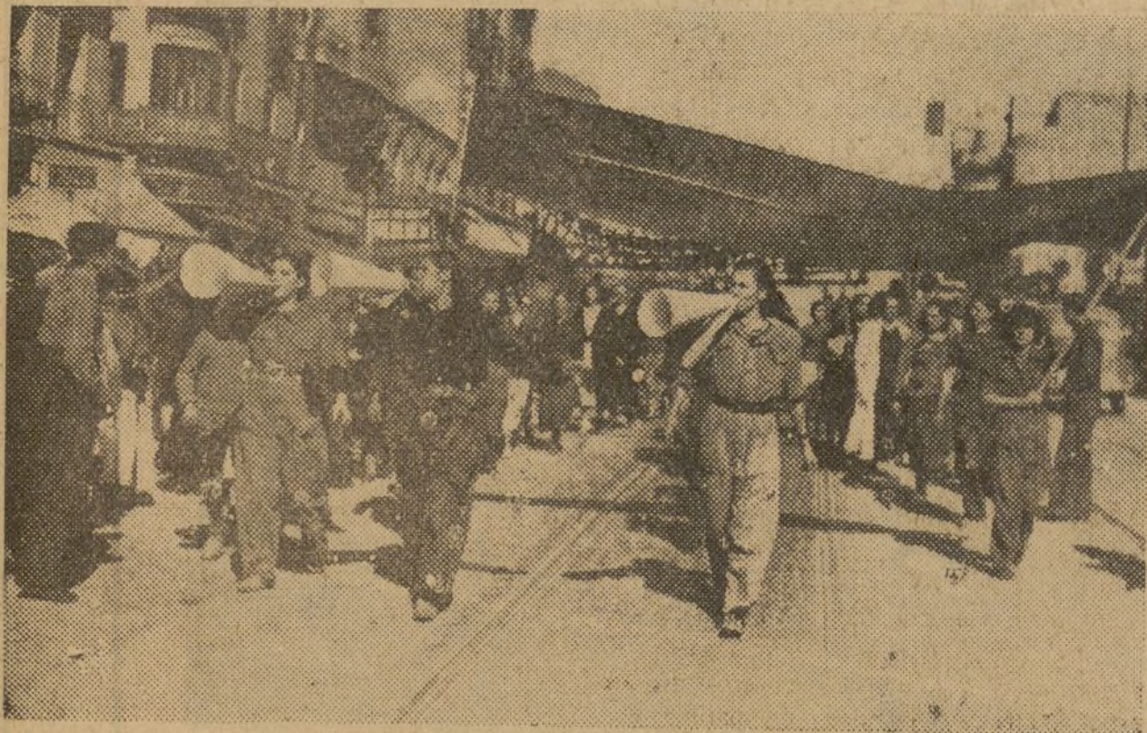
La campaña de agitación del 5.º Regimiento