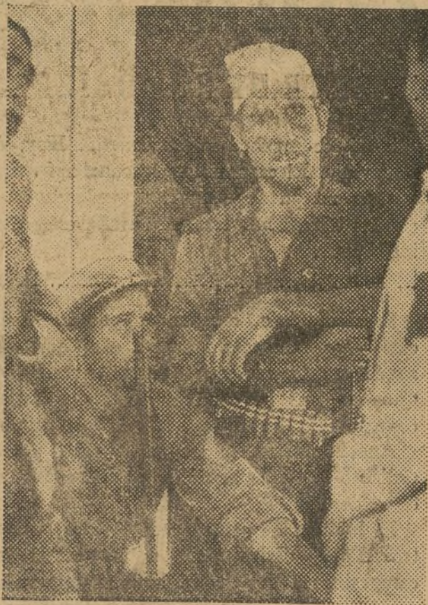
Puesto de guardia en el frente de Andalucía

Quinto. El sitio más seguro para estar en caso de ataque de aviones es la proximidad de las fuerzas enemigas. Si nos colocamos a 100, 150 metros de las posiciones enemigas estaremos en completa seguridad contra los ataques de su aviación, ya que al tirar en este caso arriesgarían tirar contra sus propias fuerzas. Así el mejor medio contra los ataques de aviación será una ofensiva nuestra rápida y enérgica contra el enemigo.