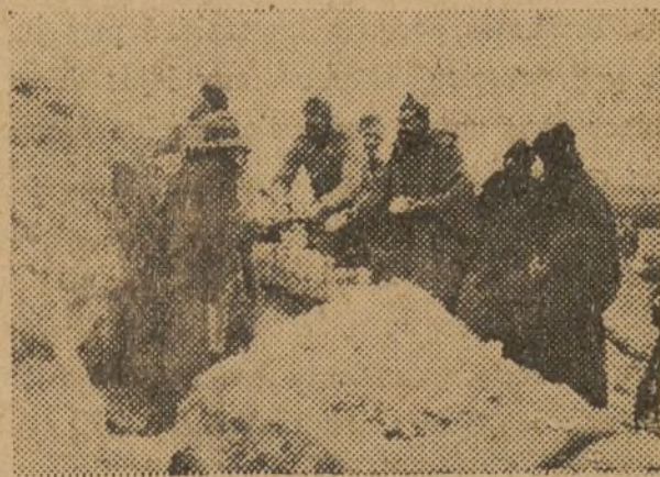
Escenas del frente

Dijo el coronel que quería expresar su gratitud al pueblo de Barbastro, a los milicianos catalanes que con él han compartido los días amargos de lucha contra el fascismo. “Recibid mi gratitud, que es grande hacia vosotros en los momentos trágicos de la lucha, en los momentos en que supisteis escuchar mi voz alentadora para acudir a los puestos de peligro. Un recuerdo a los camaradas caídos en la lucha. Y la esperanza de que este sublime ejemplo dado por ellos sea el aliento más fuerte para vuestros pechos, libres hoy día y libres en el porvenir del fascismo. Mi gratitud al pueblo ruso, que nos ha ayudado moralmente para contribuir a la derrota del fascismo. Mi gratitud a todos vosotros, y tened la seguridad de que el camarada Villalba será el primero en caer al frente de vosotros antes de que el fascismo pise tierras de Aragón.”