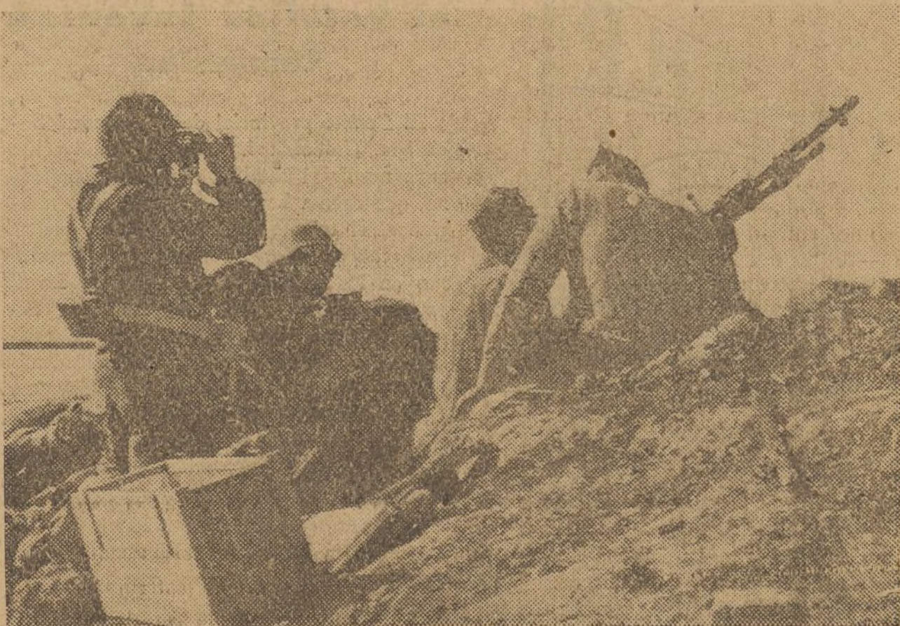
Escenas del frente