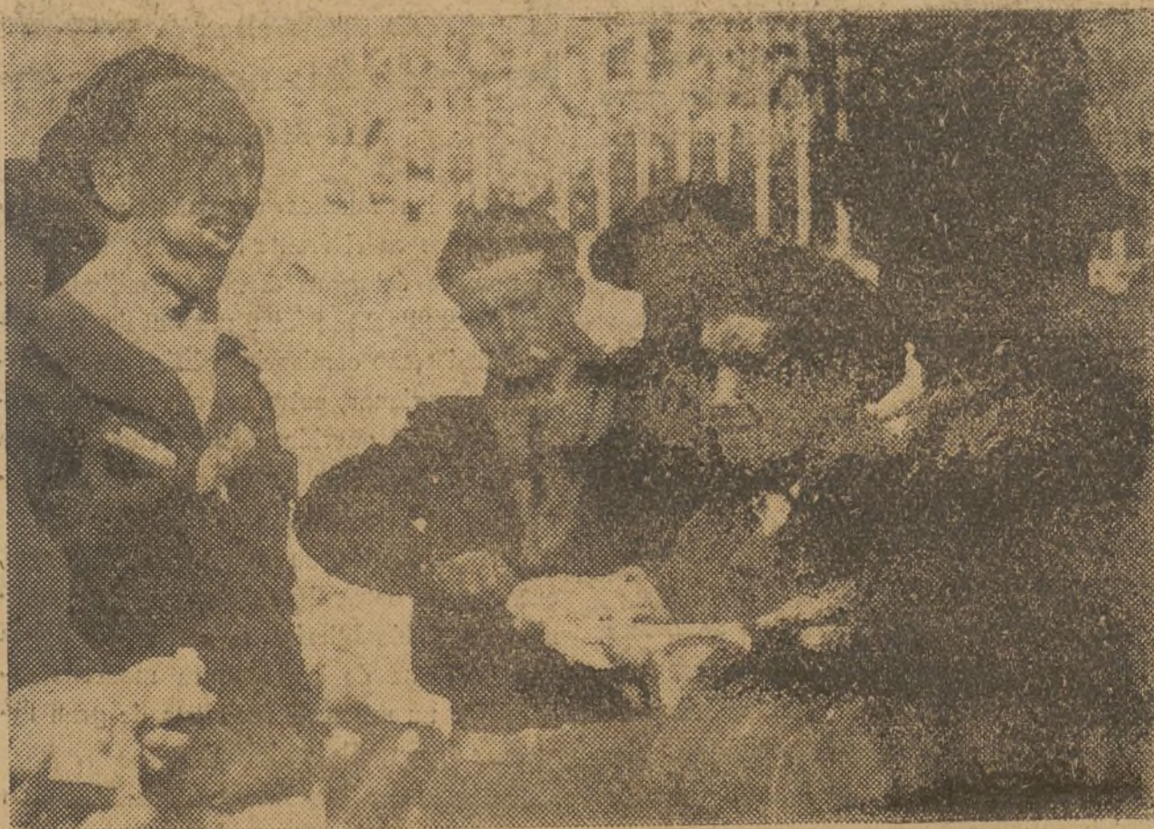
ESCENAS DEL FRENTE.—Durante la comida los milicianos comentan los incidentes de la jornada alegremente

"La noticia que dicen procedente de un radio captado a Moscú, y que ha empezado a circular con insistencia, no tiene fundamento alguno y sólo puede haber perseguido el objetivo de una provocación, por lo que se desmiente en absoluto."