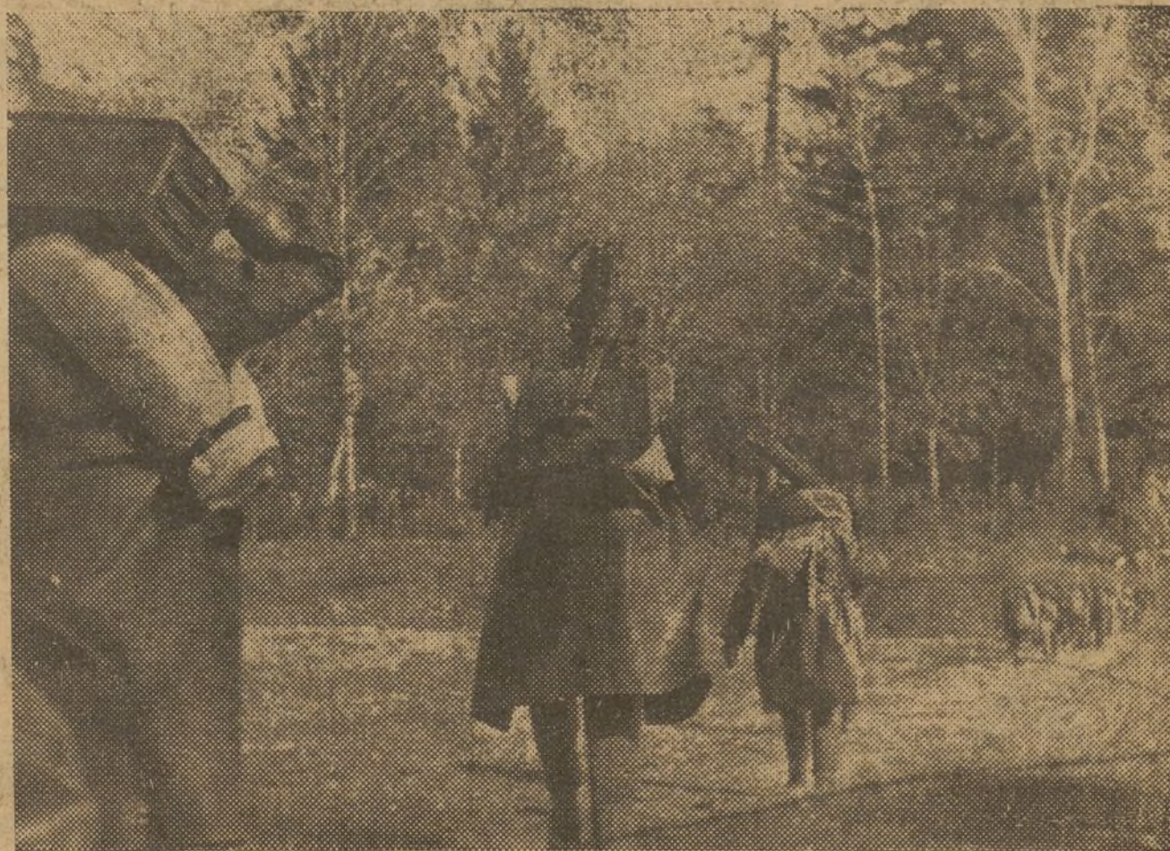
ESCENAS DEL FRENTE. — Nuestras fuerzas en un avance

En estas hojas se dice, entre otras cosas: "La rebelión de los militares españoles ha servido de estímulo a otros Franco y Mola en Méjico".