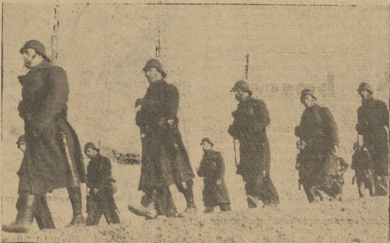
Los defensores de Madrid son el orgullo de los antifascistas del mundo entero

verdadera catástrofe. Así tiene que ser, por lo menos, y para que lo sea hemos de poner todos de nuestra parte lo más y lo mejor. Iremos todos a la victoria, porque no hay ni puede haber en esta histórica contienda otra disyuntiva. Triunfar o morir. ¿Y quién podrá matar, destruir a todo un pueblo puesto en pie para defender unas libertades que son la base de su propia existencia? Lo impediremos todos, tratando de hacer de nuestra réplica próxima la última palabra o una de las últimas, y acallar después y sin tardanza al enemigo de una vez para siempre.