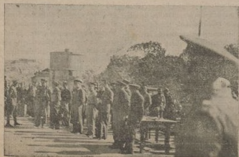
Jefes y Oficiales con el camarada Comisario en la presidencia del acto.

Responsabilidad, y que se caullen de una vez los que desconocen el sentido de esta palabra.