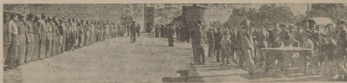
Un ejército disciplinado orgullo de nuestra victoria. Su disciplina podemos apreciarla en la Revista de Comisario que tuvo lugar en el Regimiento de Artillería de Costa núm. 3.