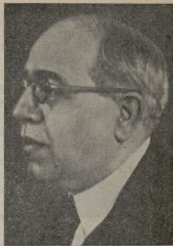
Lia Ekscelenca Moŝto la Prezidanto de la Respubliko Emanuelo Azaña kaj Díaz

Hodiaŭ, en ĉi tiu tago, al tiuj soldatoj flugas nia admiro k nia danko, kun la aserto ke ilia ofero tre estos utila por svingi niajn rajtojn, laŭ sola nun ebla maniero. Ni ne kulpas, se por gajni prestiĝon estas necese gajni batalojn. Oni trudis al ni la kruelan dilemon akiri la rajton per la forto. Ĉu forto do?... nu bone, jen la tutan de Hispanio! Post nia venko, sur tiu kampo de la forto, certe brilos la pura rajto de la Hispana Respubliko; ĝi brilos, tiel intense k hele, kiel brilas nun, en ĉielo, la suno de Madrido!