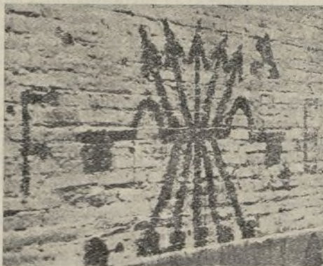
Almenaŭ per emblemoj, la hispana faŝismo trompas neniun! Jugo k sagoj, kiel klara blazono, malindigas muron de grava vilaĝo, ĵus rekonkerita en la fronto de Madrido.

Oni rigardas, kiel la tankoj grim-padis la montetojn, en atako al vilaĝo Quijorna. Kelkaj falegis sur sia dorso, vundite de la kanonoj de la faŝistaj pozicioj. La aliaj kontinuas k pistis la tranĉeojn de la civilgardistoj. La vicoj de tankoj ĉirkaŭis la vilaĝon.