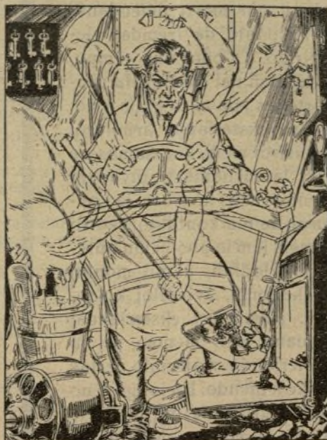
La laboro estas universala motoro Ayuntamiento de Madrid