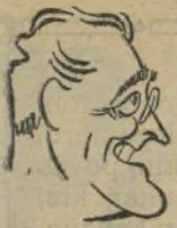
ROOSEVELT Usona Prezidanto