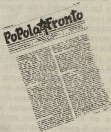
Unua numero de la nederlandlingva POPOLA FRONTO

En nia milito, en nia dramo, la internacia gazetaro estas gravega faktoro. Jam ĉe la komenco, afero tiel klara, tiel digna, kiel tiu de popolo staranta en defendo de rajto k leĝo, aperis en la ĉefaj paĝoj, de la reaktia k trusta gazetaro, kiel brua tumulto de «ruĝaj» bandioj. La honestaj modestaj gazetoj, de laboristaj k veraj demokrataj partioj, ba-