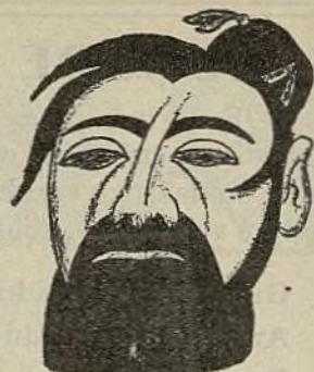
Itala delegito Grandi

Antaŭ ol la komenco de la Ne-Interveno, Germanio k Italia abunde provizis la ribelulojn; sed post alprenado de la fama komitata decido, tiuj nacioj ruze perfidis konstante sian subskribon, kiel ĉiam ili agis.