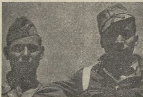
Du junaj maturoj, forkurintoj el faŝista kampo, kiuj nun estas fervoraj politikaj komisaroj k plenrajtaj civitanoj en nia armeo

ELDONO DE GRUPO LABORISTA ESPERANTISTA VALENCIA (Hispanio) REDAKCIO KAJ ADMINISTRACIO: STRATO MAR, NUM. 25