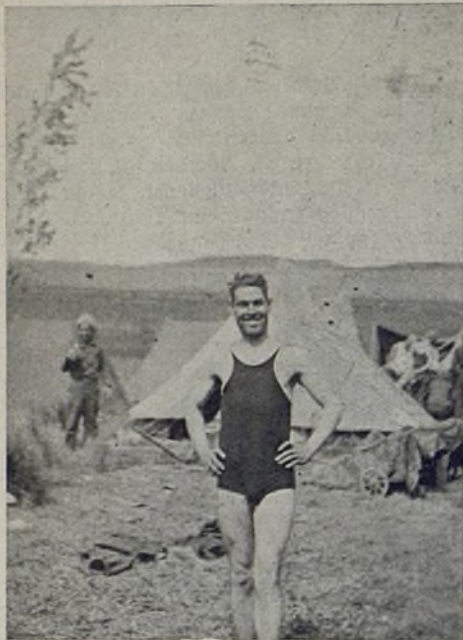
Balneario-Campo. Kurort Zeltlager.