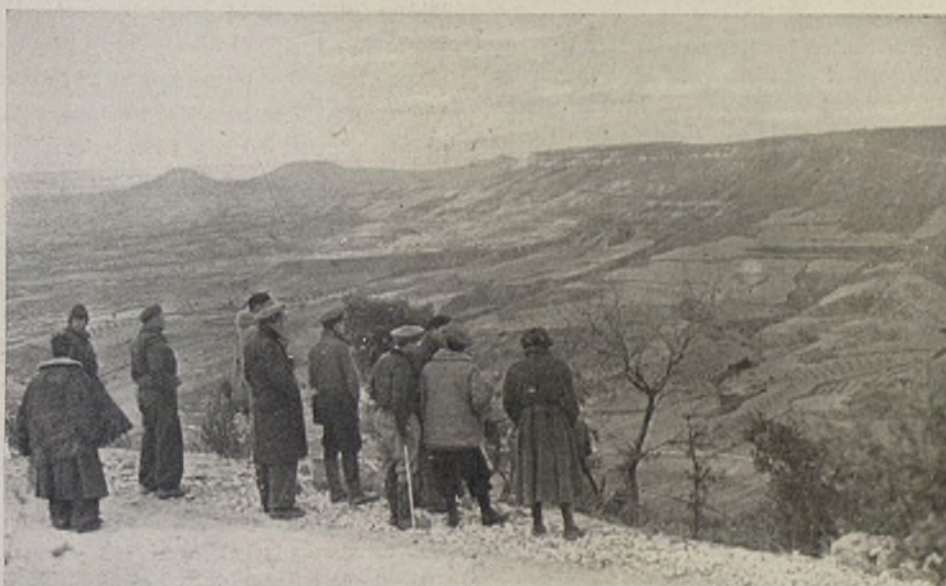
Nuestro Estado Mayor observa la Artillería. Unser Stab bei der Artilleriebeobachtung.