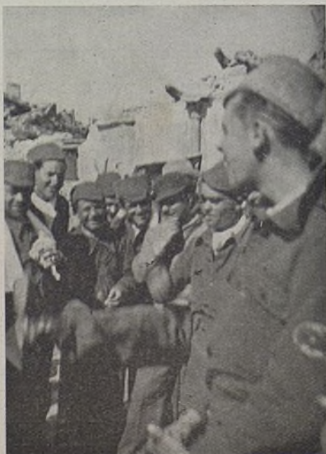
Einer erzählt einen lustigen Witz. Los camaradas bromean.