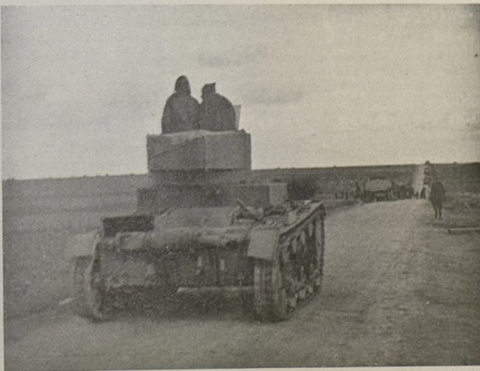
Dispuestos para la ofensiva.