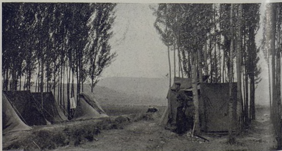
Tiendas de campaña de la Compañía de Ametralladoras. Zeltlager der M. G.-Kompagnie.