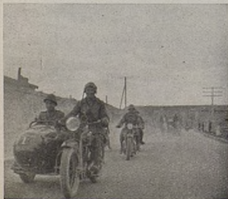
Un viaje rápido. Auf eiliger Fahrt.