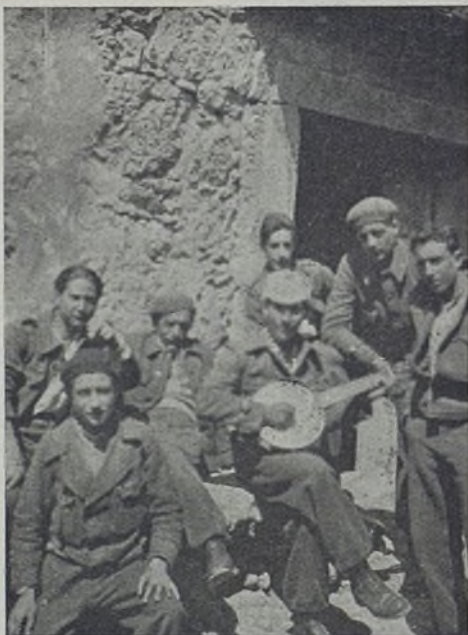
Horas felices en el Batallón Hans Beimler. Fröhliche Stunden beim "Hans Beimler" Bataillon.

4. Das Erklären der Manöver unserer Tanks während des Sturmes auf die feindliche Linie dürfte für die Begleiter kaum durchführbar sein, selbst nicht durch Zeichen. Ausserdem ist es unzulässig, die Infanteristen darauf einzustellen, dass sie im Kampfe ausser auf die Signale ihres Gruppenführers noch auf Zeichen anderen Kameraden, wie zum Beispiel der Tankbegleiter, achten sollen. Das lenkt nur die Aufmerksamkeit vom Kommandeur der Gruppe ab und erschwert die Führung der Truppe im Kampf, was das Eintreten von Verwirrung in unseren Reihen erleichtert.