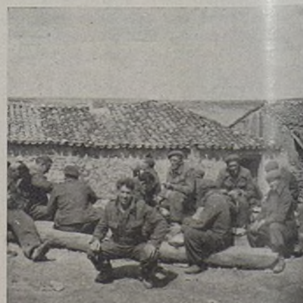
Im Ruhequartier. En reposo.