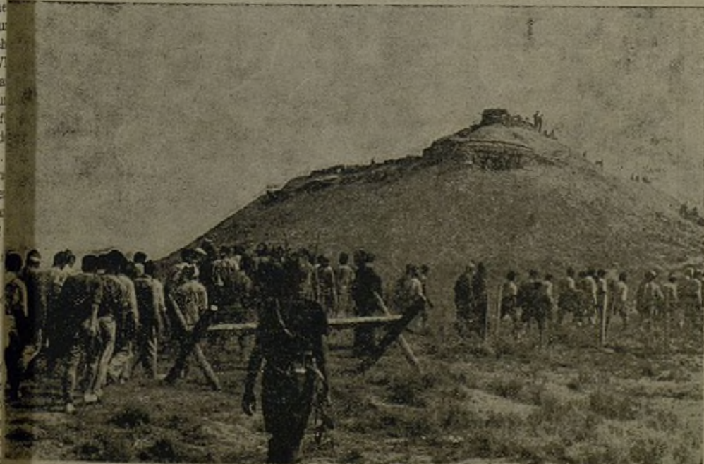
Die Gefangenen von Belchite werden abgeführt.

Gefangene sagten aus, dass der faschistische Generalstab die radiotelegraphisch angeforderten Verstärkungen deshalb nicht schickte, weil er die Positionen um Quinto und ganz besonders die auf dem südlichen Höhenkamm für uneinnehmbar hielt. Dennoch wurde auch diese letzte Position nach heftiger Artilleriebeschuss von der 11. Internationalen Brigade im Sturm genommen. Auch hier wurden zwei Geschütze erbeutet.