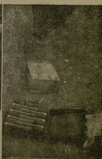
Armamento y munición que hemos cogido al enemigo al conquistar el pueblo de Quinto. Izquierda: Munición de artillería francesa. Medio: Cañones ingleses. Derecha: Bombas de mano alemanas.