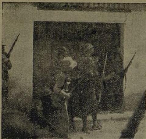
Cuidadosamente avanzan los camaradas; los fascistas, escondidos, todavía disparan. Versichtig dringen die Kameraden vor, die Faschisten schliessen noch aus Verstecken.

Ausser 830 Gefangenen verloren die Faschisten bei den Kämpfen um Quinto weitere 500 Mann an Toten und Verwundeten. Um die Mittagsstunde des 26. August waren sämtliche feindlichen Widerstandsnester liquidiert. Damit waren die der 11. und 15. Internationalen Brigade gestellten Aufgaben ehrenvoll erfüllt.