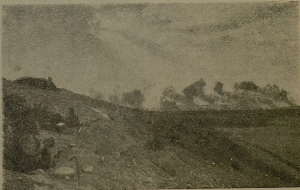
Belchite im Feuer unserer Artillerie.

Die Erwartungen unserer Chefs zu erfüllen und unsere bisherigen Siege noch zu übertreffen, ist uns eine Ehrensache. Wir werden mit grösster Kraftanstrengung weiterkämpfen und in treuer Verbundenheit mit unseren spanischen und katalanischen Kameraden Aragon und ganz Spanien den Händen der faschistischen Rebellen entreissen.