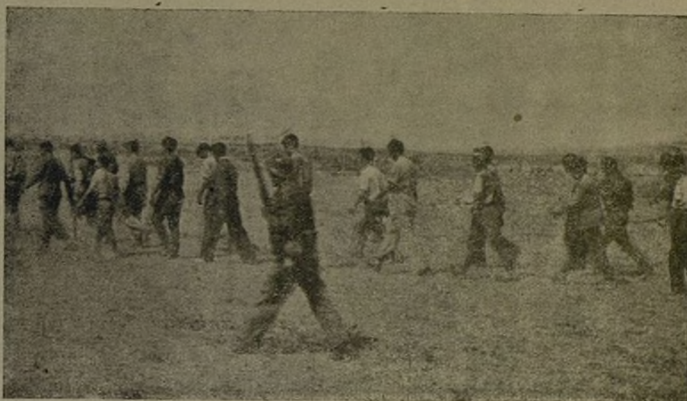
Grandes columnas de prisioneros son evacuados.

Grosse Kolonnen von Gefangene ziehen rückwärts.