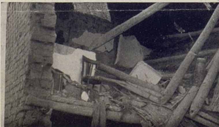
Die Feinde bombardieren die Wohnhaeuser. Los enemigos bombardean la población civil.

..... Dann wird Deutschland wieder frei!