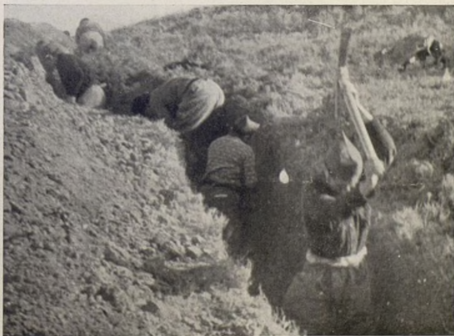
Ein neuer Graben wird ausgehoben. — Haciendo nuevas trincheras.