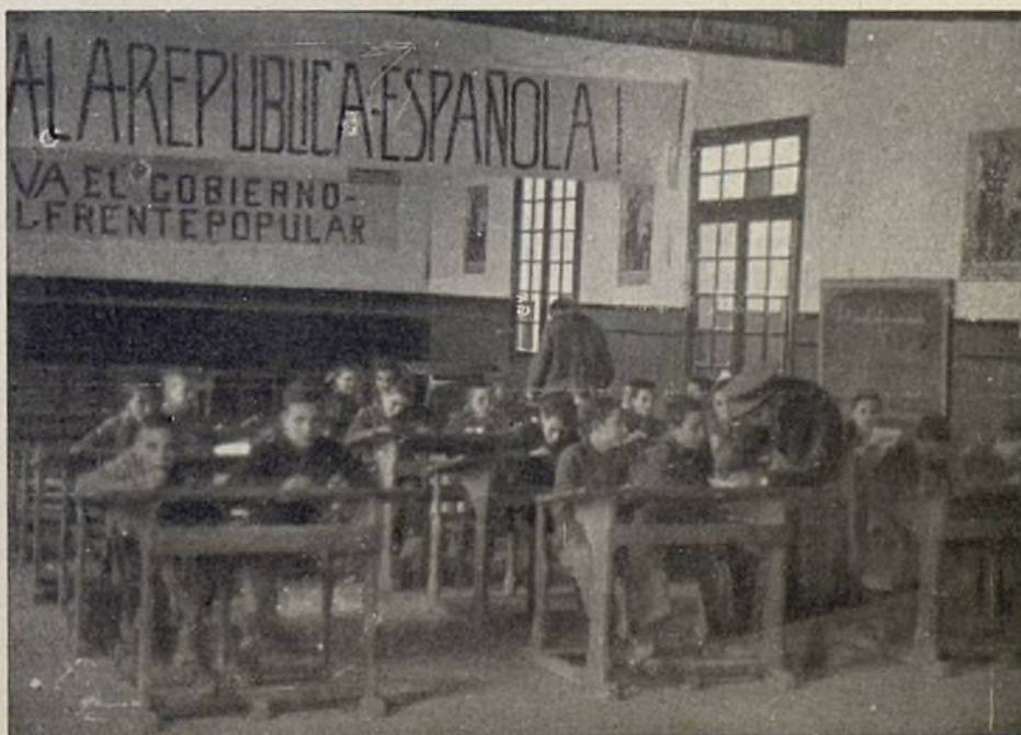
Kameraden des 4. Bataillons haben die Dorfschule eingerichtet und leiten den Unterricht fuer die Kinder. — Los camaradas del 4.º Batallón han instalado una escuela y dan lecciones a los niños.

Die Unversoehnlichkeit Ernst Thael- manns gegen alle Feinde des Volkes und der Freiheit mahnt uns, unsere Kraefte und Anstrengungen zu verfiel-