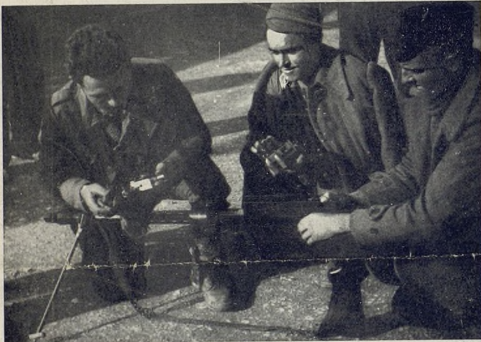
Froehlich reinigen sie ihr L. M. G.—Con mucho afán limpian la ametralladora.

Nervenprobe für uns, umso mehr als wir sehr dicht zusammenlagen und daher die Gefahr, starke Verluste zu erleiden, gross war. Es kam ein Schwanken in unsere Linie. — Der Abschnitt Kommandant zog daraufhin die beiden anderen Brigaden zurück in Reserve. Jetzt hatten wir den Abschnitt allein zu verteidigen. Unsere Linie war jetzt sehr dünn besetzt. Wir schoben sie noch ein Stück nach vorn, näher an den Feind heran. Die feindliche Artillerie und Aviation lud dann ihre «Grüsse» meist hinter unserer Linie im freien Felde ab. Unsere Front festigte sich, wurde gehalten.