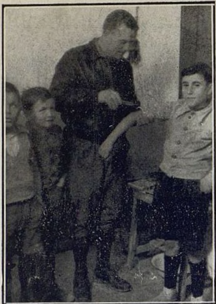
Unser Arzt impft die Dorfjugend. Nuestro médico vacuna a los chicos del pueblo.