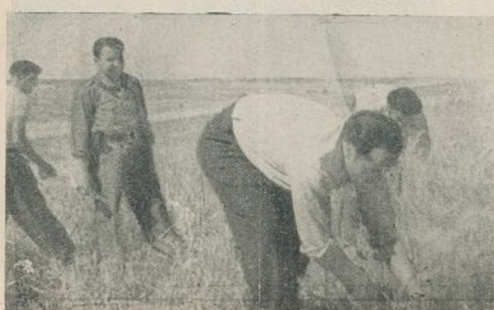
Nuestros jefes colaboran en la siega

Han organizado ya manifestaciones, que se celebrarán en todo el mundo el día 18 del próximo mes de julio.