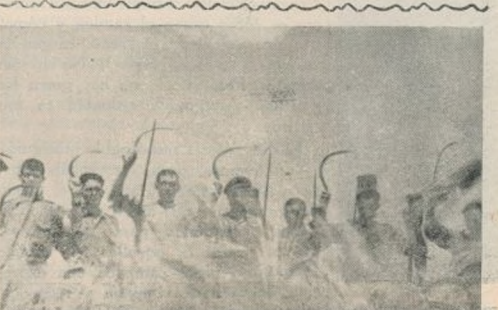
La 11 División ayuda a los campesinos