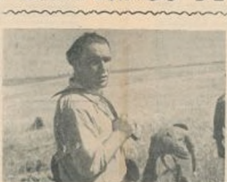
Trabajo de hoy, bienestar de mujeres