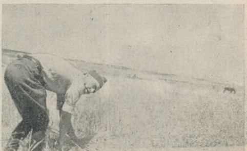
Rodríguez trabaja en la recolección de la cosecha

En nombre Gobierno y mío propio me complace en enviar a usted, para que lo haga extensivo a esos bravos luchadores 11 División, nuestro agradecimiento por su comunicado condolencia bombardeo Almería barcos extranjeros y adhesión inquebrantable le prestan; tene la seguridad que Gobierno legítimo de la República sabrá cumplir con su deber. Un saludo.