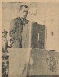
El presidente de la Colectividad de Campesinos