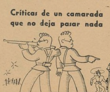
Resulta tan buen soldado como censor despiadado.