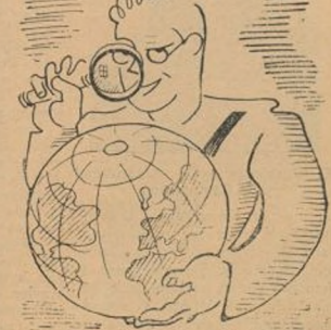
Con un sentido profundo hablará de todo el mundo.