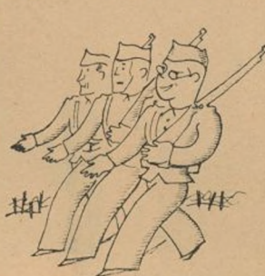
Por ser osado y valiente fué el primero en ir al frente.