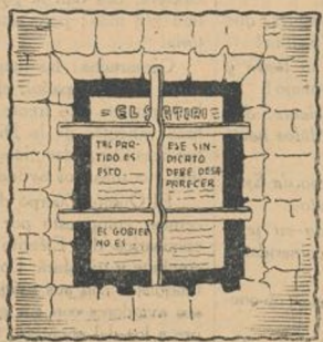
¿Diarios de la divergencia?... palo y cárcel sin clemencia.