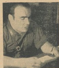
Comandante-jefe de la 11 División, Enrique Lister.