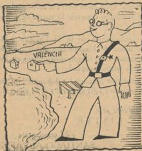
Las playas, para el soldado; jamás para el emboscado.