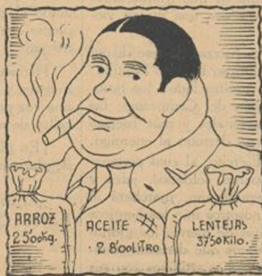
Vendedor desaprensivo, fusilado antes que vivo.