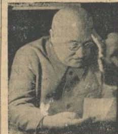
El general Miaja, jefe del Ejército de operaciones del Centro.

El jueves tuvo lugar la primera de las emisiones especiales de radio organizadas por la Inspección del Centro del Comisariado de Guerra. Intervinieron: