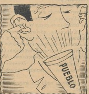
Quien al Gobierno no apoye al pueblo burja y desoye.