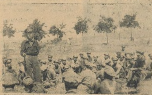
El comisario de la 100 Brigada prepara a los soldados.