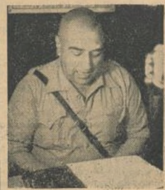
Díaz Hervás, comisario del Primer Cuerpo de Ejército.