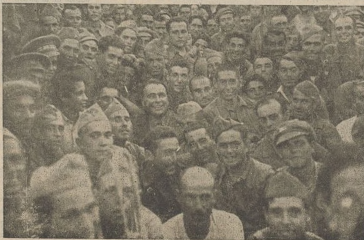
Después de los duros combates trocados en victorias, por la inteligencia de nuestros jefes y el heroísmo de nuestros combatientes, soldados y jefes vuelven a reunirse en los ratos de humor con verdadera camaradería.

Ayer mañana se verificó el entierro, asistiendo el Jefe de la Brigada y una compañía de la misma, con bandera y música.—Fe-