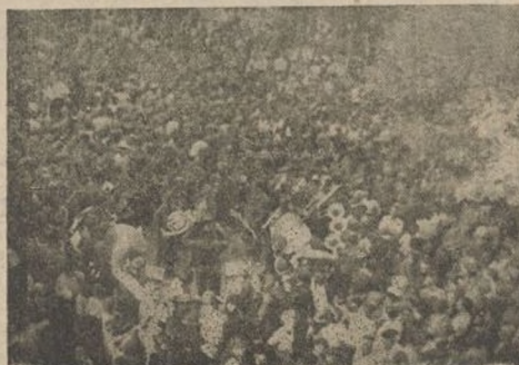
Actuación de nuestra Banda en la Plaza de la República de Caspe. Los soldados de nuestra División fraternizan con el pueblo