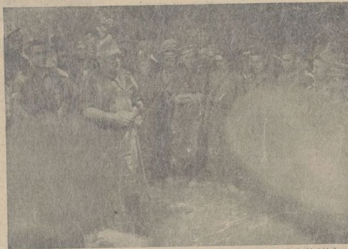
El general Miaja en un sencillo y cordón al salir de Madrid donde ha desarrollado sus hazañas más gloriosas

El vapor pudo llegar al puerto de poco después se hundió.