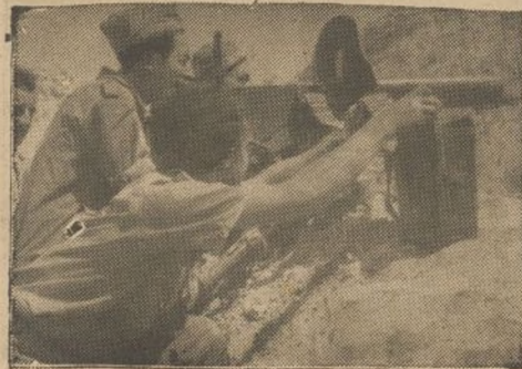
Una ametralladora nuestra hostilizada al enemigo