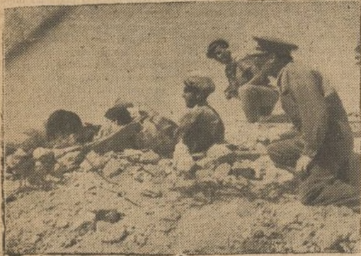
Nuestros soldados observan al enemigo