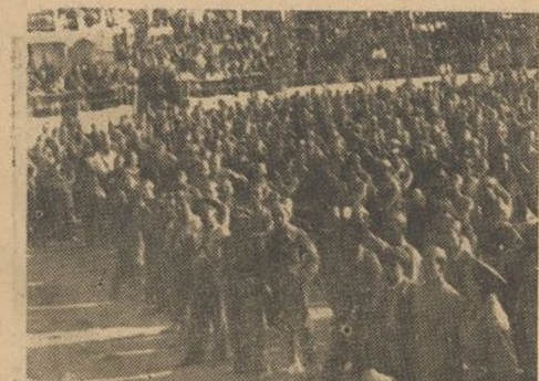
Una vista del aspecto que presentaba la plaza de toros de Alcañiz, donde se celebró el acto