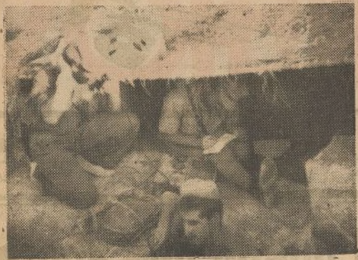
Un puesto de mando de la 11 División en pleno combate