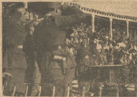
Terminado el acto, los oradores y el público escuchan "La Internacional"

sias de liberación de toda la Humanidad sojuzgada y oprimida asentada sobre un mundo incomprensible, lleno de injusticias, de penalidades, de sufrimientos para los más y de vanagloria y dicha para los menos. Rusia, a pesar de los obstáculos impuestos por todos los Gobiernos y clase capitalista del mundo entero, se abrió paso, con mano fuerte, arrollando con su pisada segura los prejuicios seculares, la barrera inhóspita de los pueblos, las trabas y sinsabores impuestos en un camino que tuvo que doblegarse ante el ímpetu de una masa que rompió sus cadenas para ser libre.