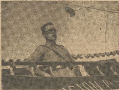
El teniente coronel Casado, jefe del 21 Cuerpo de Ejército, en un momento de su discurso

terminó diciendo: Yo, en nombre vuestro, aseguro al jefe del 21 Cuerpo de Ejército, que tenga la seguridad de que nuestros soldados ansían, de minuto en minuto, el momento de entrar en combate para demostrar una vez más que no retroceden jamás y que aniquilan al enemigo.