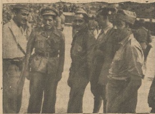
Varios jefes y comisarios de nuestra División, sorprendidos por el fotógrafo.