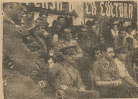
Aspecto que presentaba la tribuna