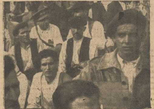
Los campesinos y obreros de Alcaniz oyen la palabra de nuestros jefes en el acto celebrado el pasado viernes.

El acto, al cual asistieron las fuerzas de las tres Brigadas, resultó brillantísimo, desfilando al final las tropas ante el Estado Mayor.