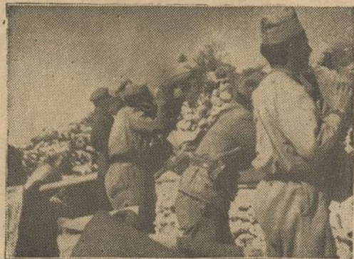
Vigilantes, los soldados de la 9.ª Brigada, acechan los menores movimientos del enemigo