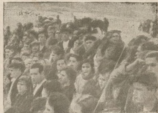
Campesinos aragoneses contemplando el paso de los soldados del Ejército Popular por el pueblo.

Las declaraciones del señor Portela no pueden ser más importantes, pues revelan que hace tiempo que se venía fraguando la conspiración contra las libertades de nuestro pueblo.