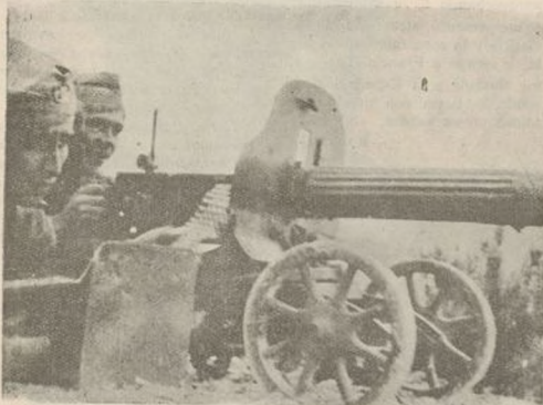
El soldado debe capacitarse técnicamente estudiando el manejo de las armas.

Antes, en el ejército antiguo, en ese ejército corrompido que para nosotros murió el 18 de julio de 1936, los mandos militares eran señoritos chulos que a costa de nuestro sudor habían estudiado la carrera militar, no para defender nuestra patria, sino para lucir unas estrellas y rebelarse en todo momento contra las leyes que daban alguna libertad los oprimidos y de esta manera poder seguir siendo los dueños de todas las riquezas, seguir disfrutando de