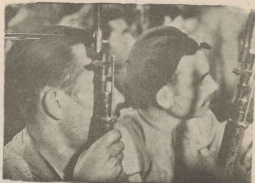
Los nuevos reclutas incorporados a nuestra Brigada escuchan con atención las instrucciones de los jefes.

Delegado de la Tercera Compañía, Cuarto Batallón