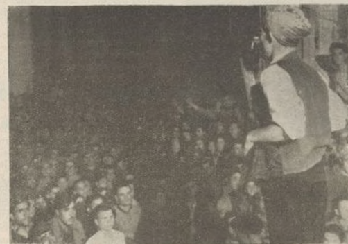
En la España republicana los soldados confraternizan con la población civil.