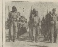
Los nuevos soldados del Ejército Popular, ya incorporados a nuestra División, practican la instrucción, necesaria para formar en las filas de acero de nuestras Brigadas

Veterano, tú enseñarás al nuevo soldado a ser un auténtico combatiente de nuestro Ejército. Al hacerlo, prestarás a nuestra patria el mejor servicio que puedes hacerle: multiplicar tu abnegación, tu capacidad, tu aportación a la victoria.