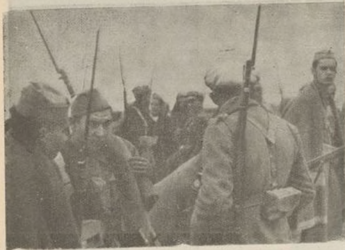
En el combate y en el descanso, estos soldados heroicos de nuestra Brigada sólo tienen una preocupación: vencer.

Nuestro Ejército, forjado con grandes sacrificios, salido de la