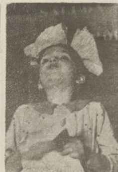
Esta niña corresponde al cariño de los soldados de nuestra Brigada recitándole una poesía.

Llegamos a un pueblo de Aragón, donde vamos a reorganizarnos y a prepararnos para próximos combates. Acogidos, primero con curiosidad y asombro, al ver nuestro aspecto de combatientes que acaban de abandonar las trin-