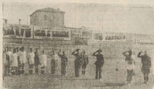
El equipo de fútbol de la Primera Brigada, preparado para tomar parte en un partido, jugado en Madrid, contra la Brigada de Tanques