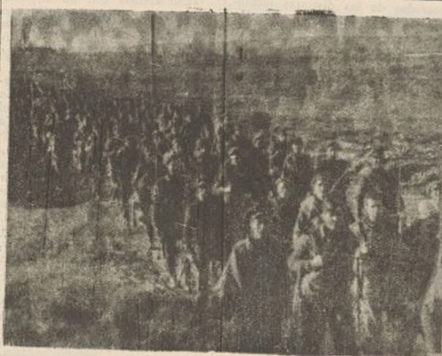
La Primera Compañía del Segundo Batallón regresa de las maniobras

Soldado del Cuarto Batallón de la Novena Brigada