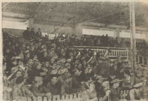
La Banda de música de la División de "El Campesino" ameniza la celebración de un partido de fútbol celebrado entre nuestra Brigada y una selección de la 46 División. En este partido, como en todos, el pabellón de nuestra Brigada quedó bien alto.

A su regreso a los frentes del Este, la Primera Brigada saluda a los camaradas que en las trincheras de Aragón defienden la independencia de España, y promete que todos juntos, sin que ninguna diferencia los separe, marcharán adelante, conquistando con la punta de las bayonetas nuevas victorias para el Ejército Popular