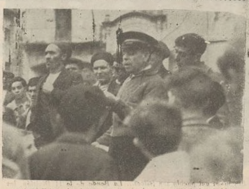
El pregonero anuncia nuestras fiestas de confraternización