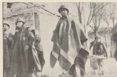
Soldados de la Novena Brigada en las calles de San Blas

También han contribuido las célebres «chavolas», en las que puede verse en algunas en un cartón a un lado escrito «Villa Petras», «Vino en ésta de Buñol», «Villa Chogay», lo que demuestra el espíritu de nuestros soldados y su fuerte ánimo de combatientes. 20-12-37.