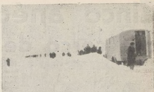
Ni la nieve ni la helada impidieron que nuestros abnegados sanitarios cumplieran en todo momento su cometido

Los muleros que hacen el municionamiento de las fuerzas también han estado en su puesto en todo momento, no habiendo carecido los soldados de las municiones a su debido tiempo. Puede decirse lo mismo de los servicios de Intendencia y demás servicios auxiliares.