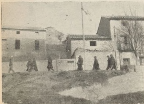
Después de la conquista del barrio de San Blas... Cerca tiembla Teruel ante la inquebrantable decisión de vencer del Ejército Popular... Y aun no repuestos del cansancio de esta primera jornada, los soldados de la Novena Brigada se disponen a luchar de nuevo, reforzando las líneas de resistencia con más entusiasmo aún... Saben que el reloj de la victoria no espera. Resistirán con el mismo brío que atacaron, y así devolverán Teruel a la República.

Son los soldados de la 11 División, de su Novena Brigada... Se les ha marcado un objetivo difícil