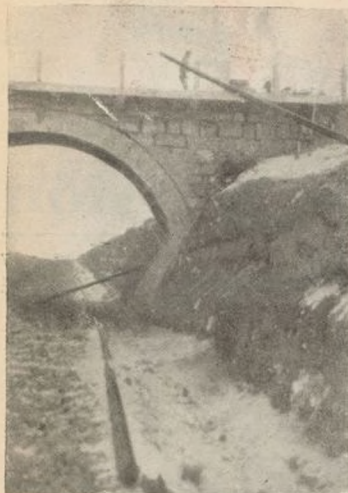
Fué el Tercer Batallón de la Novena Brigada el que dejó a Teruel sin comunicaciones. Con un arrojo ejemplar y una audacia sin límites, los soldados cumplen este difícil e importante objetivo en las primeras horas de la mañana con una precisión admirable

Al amanecer del día 15, en los Altos de Celadas, un frío penetrante bordea las caras como un cuchillo helado. Desde que salieron de Villalba Baja los soldados esperan impacientes la orden de ataque.