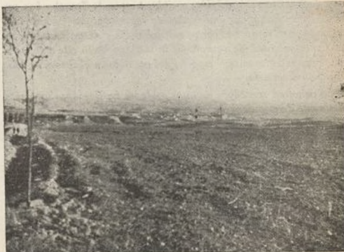
Por estos llanos, bajo el fuego enemigo, se abrieron paso hacia Concud, que se divisaba a lo lejos, las fuerzas de la Primera Brigada, ayudadas eficazmente por los tanques.