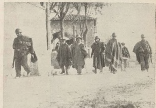
Los vencedores... Soldados del Segundo Batallón pasean por las calles del barrio de San Blas, momentos después de haberse izado la bandera de la victoria en sus casas

Aquella misma tarde nuestros soldados hicieron tres prisioneros que se metieron en nuestras líneas.