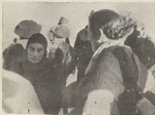
Junto a la carretera, esperando los camiones