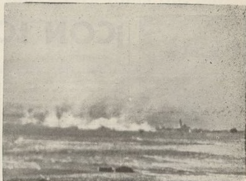
Concentraciones enemigas, en las cercanías de Caude, bombardeadas por la «Gloriosa». De aquí partieron las fuerzas de choque enemigas que se rompieron los dientes frente a nuestras alambradas.