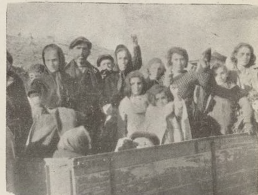
Rápidamente se traslada a los evacuados a zonas alejadas del fuego

Otras que nos cuentan no son para reírse. Los fusilamientos se han contado en Teruel por centenares y algunos de ellos con un aparato de ferocidad que no deja nada que desear a los de Badajoz, Galicia y tantos otros sitios. Una sola de las escenas que cuentan escalofría: un individuo de Falange (que, por cierto, no aseguraron que se encontraba aún peleando en los últimos reductos que tenían los sitiados), encontró a 16 significados dirigentes obreros en la mayor plaza de Teruel, y, en presencia de gran cantidad de señoritos y señoritas de Falange, los mató, en medio de griterío algarazara, dándoles primeramente tiros