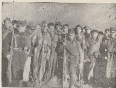
Prisioneros. Hombres, muchos de ellos engañados o forzados, que, en su rendición, hallarán su condición de trabajadores libres.

(Dibujos por Lorenzo Viorreta, soldado de la 11 División)