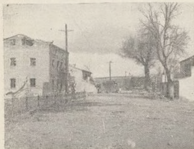
El puente de Arganda, sobre el Jarama. Puerta de Madrid que el enemigo no pudo ni podrá pasar.

Allí estuvo la 11 División en primera línea y como eje de la gran contraofensiva que, victoriosamente, se llevó a cabo contra hombres, material y técnica alemanes, que, en brutal ataque, querían irrumpir en la carretera de Valencia, con miras al cerco del invencible Madrid.