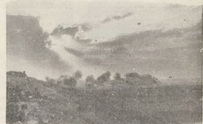
Belchite bombardeado, después de haber fracasado el enemigo en su intento de auxilio a los sitiados. Lo impidió la férrea resistencia de los soldados de la 11 División.

El frente de Aragón, que hasta entonces no había sido escenario de ningún gran combate, cobra trascendental importancia con aquellas victoriosas operaciones, en las que la 11 División actuó tan brillantemente.