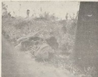
Cadáveres de moros en Garabitas.

Golpe de audacia, en el que la 11 División también tomó parte. De frente, sin una vacilación—los hombres de la 11 División saben tan bien resistir como atacar—, fueron asaltadas por el Ejército Popular las importantes posiciones de aquel cerro, donde el enemigo tenía emplazada gran cantidad de artillería. Las trincheras enemigas, tomadas por asalto, quedaron sembradas de cadáveres del enemigo.