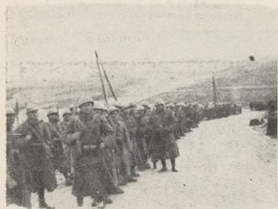
Interesantísima fotografía de la fracasada ofensiva de Guadalajara. Fué hallada en la cámara que llevaba en el bolsillo un oficial italiano muerto. Las flamantes divisiones italianas, esperan la hora de emprender la pretendida marcha triunfal, que se convirtió en una carrera tan grande como la de Caporetto.

La 11 División dejó bien sentada su «clase» en aquella prueba, que fué la descomunal derrota de las divisiones de Mussolini. La 11 División, después de cooperar a la gran derrota italiana—tiempo de frío y nieve casi como el de hoy de Teruel—, hicieron correr y persiguieron durante muchos kilómetros a los que también habían soñado con entrar en Madrid por aquel lado.