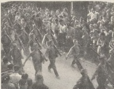
Nuestros soldados desfilan entre el entusiasmo del pueblo.

Kilómetros y kilómetros de terreno conquistó la 11 División para la República. Delimitó con audacia y valentía una línea que hasta entonces estaba indecisa, con gran peligro para nuestras armas. Hizo llegar el eco de la victoria y la libertad a varios pueblos. Los campesinos aprendieron el nombre de Lister. Vieron en el gran jefe el símbolo de un Ejército que, por primera vez en nuestra historia, es suyo, es del pueblo.