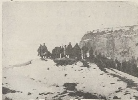
¡Frio de Teruel! Temperaturas polarés. Nuestros soldados de acero los han resistido durante dieciséis días. Al heroísmo en la lucha han unido la abnegación y el sacrificio.

rraga, delegado político de la Compañía de Ametralladoras del Tercero, y con ellos nuevos camaradas, cuyo sacrificio ejemplar nos afirma más en nuestra voluntad de vencer, vendiendo así su muerte y la de tantos hermanos nuestros caídos por defender la libertad y la independencia de nuestra patria.