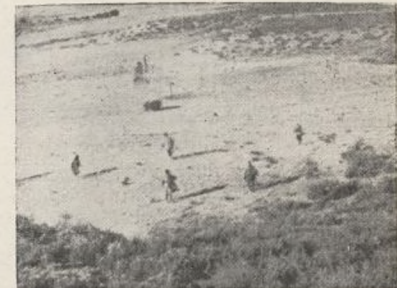
Al iniciarse la reconquista de Teruel, nuestras fuerzas maniobraron audazmente para tomar los objetivos y ocupar las líneas que, durante dieciséis días, habían de defender heroicamente de furiosos contraataques.

En el plan para el cerco y toma de la capital, se le reserva una de las partes más temibles y delicadas: establecer una línea defensiva por el flanco más peligroso, línea que ha de ser infranqueable, para que la sorprendente operación cuaje en una victoria. Para ello, los soldados de las tres Brigadas han de tomar varios pueblos y posiciones, penetrar kilómetros y kilómetros por terreno enemigo, cortar el ferrocarril y la carretera, trabajar para fortificarse y resistir los feroces contraataques que desarrolla el enemigo justamente por su flanco, como se pensaba. Con frío terrible, con nieve, con precisión, con heroísmo inigualable, todo lo cumplen los soldados de la 11 División en dieciséis memorables días de trinchera. Con este Teruel, victoria final del año, llega al máximo en su curva ascendente la gloria de la 11 División.