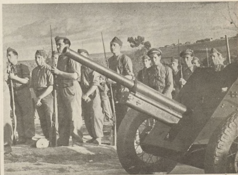
Otro momento del desfile efectuado bajo la presidencia del general. En primer término se ve una de las piezas antitanques que tantas bajas ocasionó en las filas rebeldes de Cerró Gordo.