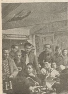
Confraternización entre combatientes y productores

con solicitud de verdaderos hermanos y camaradas. Les mostraron una por una todas las dependencias de los talleres, explicando a nuestros jefes el funcionamiento de los distin-