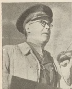
El comisario inspector del Ejército del Centro, dirigiendo la palabra a los soldados de la 11 División.