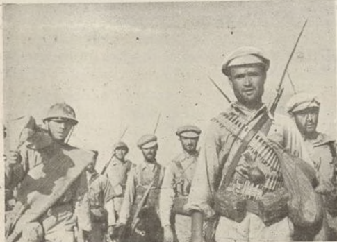
Los combatientes de la 11 División regresan del frente. Allí, en los campos de Teruel, conocieron los terribles la bravura y la combatividad de estos héroes, que superaron, anularon todos los esfuerzos del fascismo para reconquistar la ciudad perdida.

PRADAL Comisario del Cuarto Batallón de la 100 Brigada