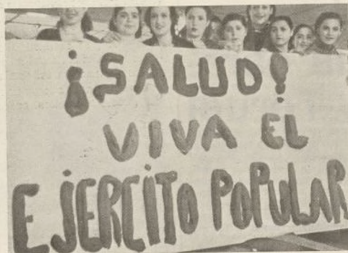
Las muchachas de la fábrica confeccionaron este cartel en honor de nuestros soldados

dos. Hizo constar la estrecha y ejemplar ligazón que une a las fábricas madrileñas con la División, y que muestra a las demás industrias de la retaguardia el camino a seguir con respecto a las demás unidades del Ejército.