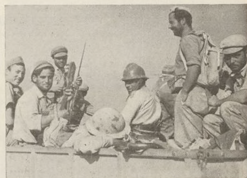
Nuestros soldados vuelven de las trincheras, donde han infligido al enemigo seria derrota.