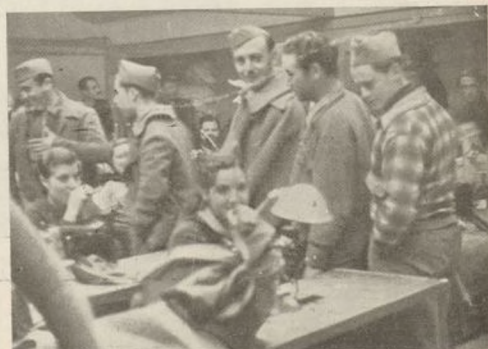
Caras sonrientes de nuestros soldados. Las obreras les corresponden. Son dos clases de héroes. Los del frente y los de la retaguardia

EN LOS PROXIMOS COMBATES: FORTIFICAR, FORTIFICAR, FORTIFICAR. N O S GRITA EL RECUERDO DE NUESTRA ACTUACION EN TERUEL