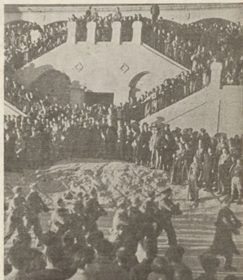
Los soldados de la Primera Brigada, después de escuchar atentamente las palabras de felicitación del general Miaja, desfilan ante él con moralidad, que habla de una disciplina militar a toda prueba.

"Ya en otra ocasión — comenzó diciendo — asistí a un acto de esta índole para imponer las insignias de ascenso ganadas en anteriores combates. En él os anuncié que el Ejército del Centro había de recorrer España de norte a sur. Vosotros diréis al partir para Aragón: ¡Bah! El general Miaja ya sabía que íbamos al combate. Pero no era así. Las alternativas de la guerra lo dispusieron de aquel modo. Hoy he asistido al acto de la entrega de una bandera en la que las muchachas de Quirós han puesto toda la habilidad de sus manos y todo el entusiasmo de su cora-