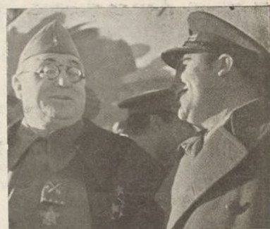
Los obreros de las fábricas madrileñas han regalado una bandera a la Primera Brigada de nuestra División. Durante el acto, el Teniente Coronel Lister y el Jefe del Ejército del Centro, General Miaja, departen amigablemente.

100 Brigada Mixta, Segunda Batallón, Segunda Compañía