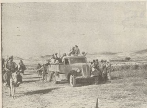
Los hombres de la Primera Brigada, después de quince días de resistencia heroica, son relevados por fuerzas nuevas, y se dirigen en camiones a la retaguardia.