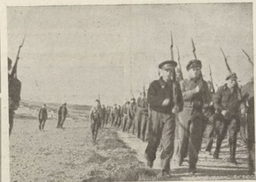
La instrucción militar, en la que se ejercitan nuestros combatientes, es el mejor vehículo de la victoria.

Se vió que los falangistas habían retirado la otra pieza de su primera situación, para emplazarla en una casa de la parte izquierda del cementerio. El cañón asomaba,