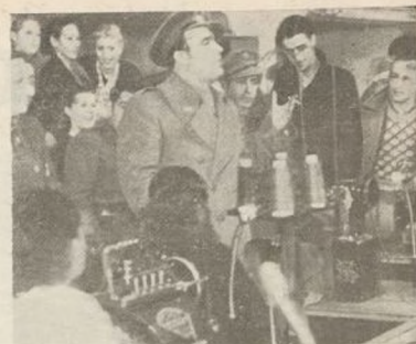
El jefe de nuestra División dirigiendo la palabra a los obreros y obreras de «Quirós»

Expresó la emoción que sentía ante un acto tan cordial como sencillo; emoción que acentuaba quizás la coincidencia de no haber hablado en público jamás. Añadió que él, como procedente del antiguo Ejército español, no había sabido nunca de la sencillez y gran-