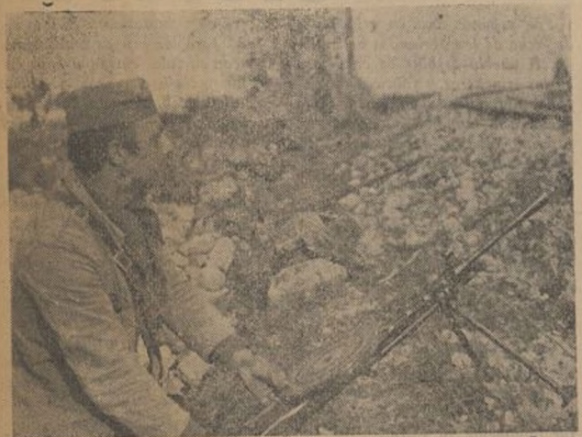
Como los héroes de la primera guerra de la Independencia, nuestros soldados luchan hoy con bravura y coraje, defendiendo la patria en peligro. Como en 1808 los invasores extranjeros serán arrojados de nuestro suelo.

"La fatiga misma sostenía nuestros cuerpos; hablábamos poco, y nos batíamos sin gritos ni bravatas, como es costumbre hacerlo en las ocasiones ordinarias. Jamás he existido heroísmo más decoroso, y a fuerza de ver el ejemplo, imitábamos el aspecto estatuaria de don Mariano Alvarez, en cuya naturaleza poderosa y sobrehumana se estrellaban, sin conmoverla, las impresiones de la lucha, como las rabiosas olas en la peña inmóvil."