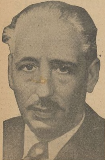
Luis Companys, presidente de la Generalidad de Cataluña y representante de todos los catalanes que luchan contra el fascismo, como antaño lo era Pablo Claris, que dirigió la lucha contra la despótica opresión del calañtoso. Felipe IV