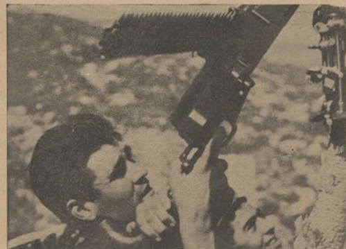
Este soldado de la Primera Brigada hace uso de su máquina antiaérea y consigue abatir con sus disparos a los aviones del crimen.