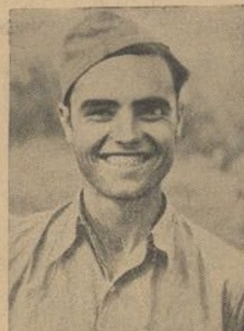
Como premio a su aplicación, y por haber dejado de ser analfabeto en el menor