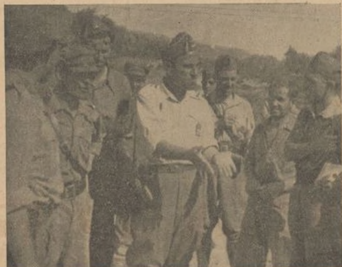
El jefe de nuestra División, hablando y marcando directrices a los oficiales y comisarios de la 100 Brigada

"La seguridad de la victoria la da el propósito inquebrantable de obtenerla." (Negrín)