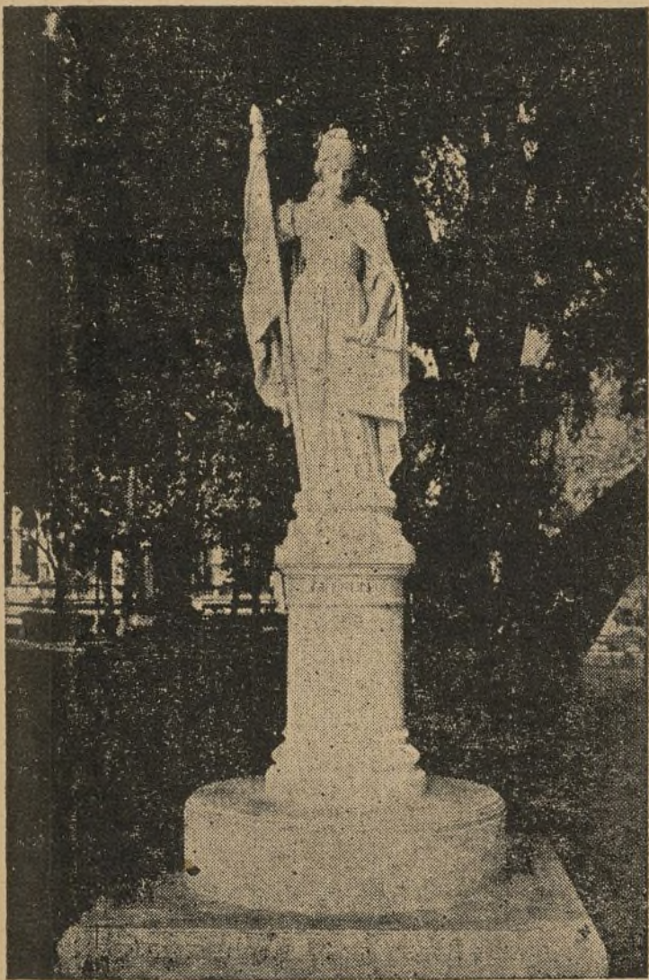
Esta otra estatua en mármol blanco que se destaca en uno de los más bellos sitios del Parque Central de Managua, representa el Comercio.

Comuníquese.—Palacio del Distrito Nacional.—Managua, diecisiete de Agosto de mil novecientos treinta y cinco.—ANDRES LARGA-ESPADA.—POR: PEREZ N.—EDUARDO BERNHEIM.—José María Fonseca, Srio.»