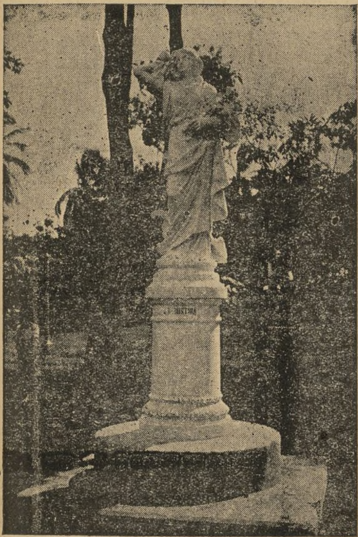
Esta estatua en mármol blanco representa la Industria, y es uno de los más bellos adornos del Parque Central de Managua.

69—Se entiende por viviendas provisionales