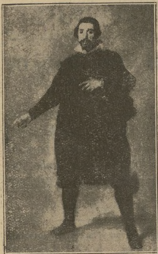
El célebre bufón Pablillos de Valladolid, debido al pincel de Velázquez

En este aspecto de su obra, Velázquez se anticipa a la obra literaria del novelista inglés Dickens; los dos exponen sus tipos de humilde condición, de una forma festiva, que bordea lo grotesco, pero no lo rebasa, y con piedad comprensiva de humanas deficiencias, ponen una leve sonrisa en los rostros de los hijastros de Natura, sonrisa que es más bien amargo y resignado reproche.