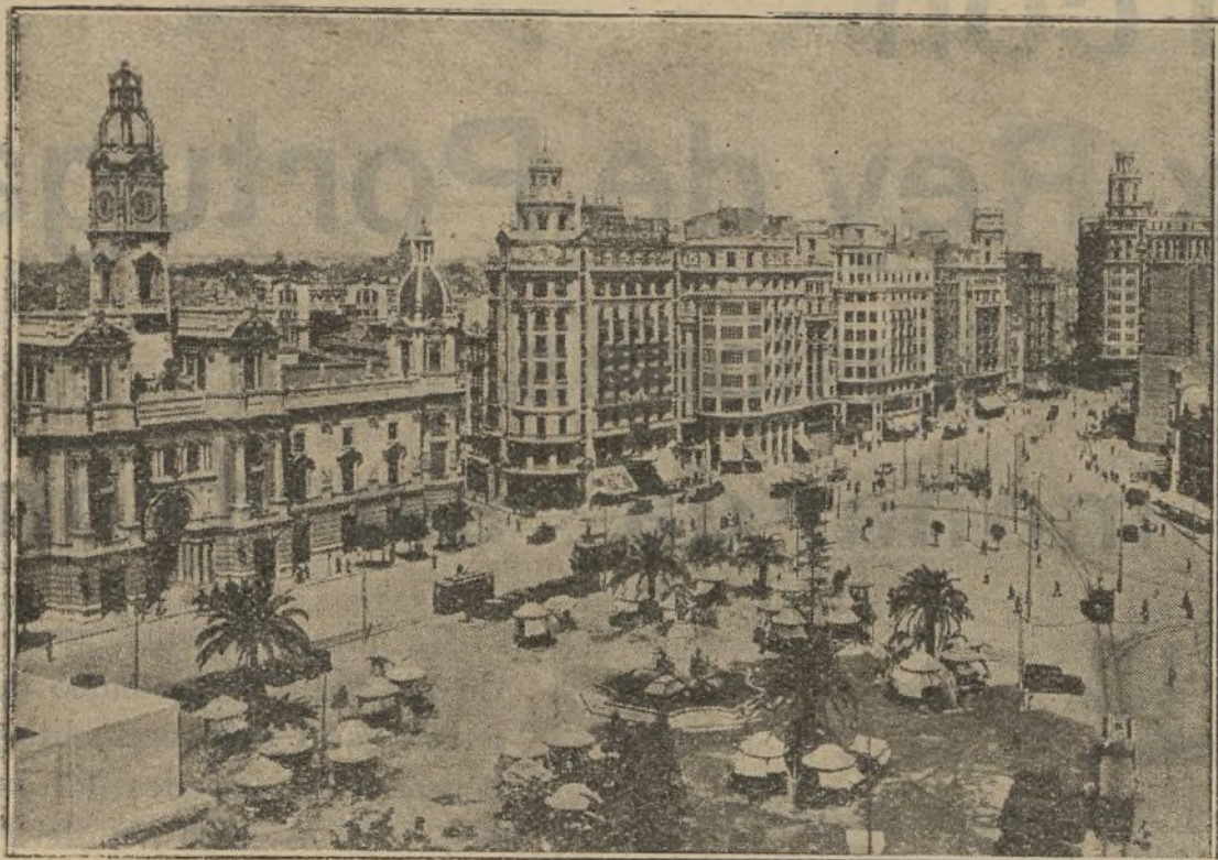
PLAZA DE CASTELAR

lles cubiertos que pasan de mil metros cuadrados de extensión. Dispone de un dique flotante para reparación de buques hasta doce mil toneladas. En el puerto exterior se hallan los astilleros de la Transmediterránea, que en la actualidad construye tres barcos.