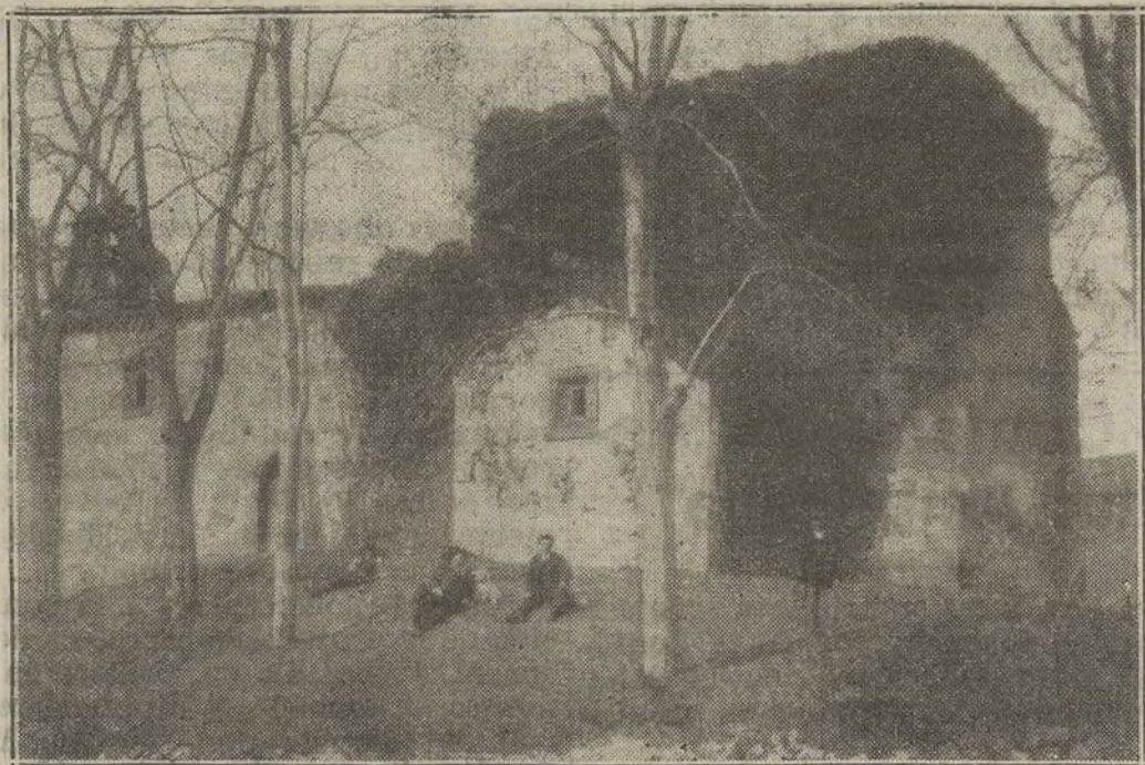
Campo de Santa Cruz, en que Pelayo libró la batalla decisiva con los moros que huyeron de la de Covadonga, y ermita levantada por Favila en memoria de la victoria de su padre.