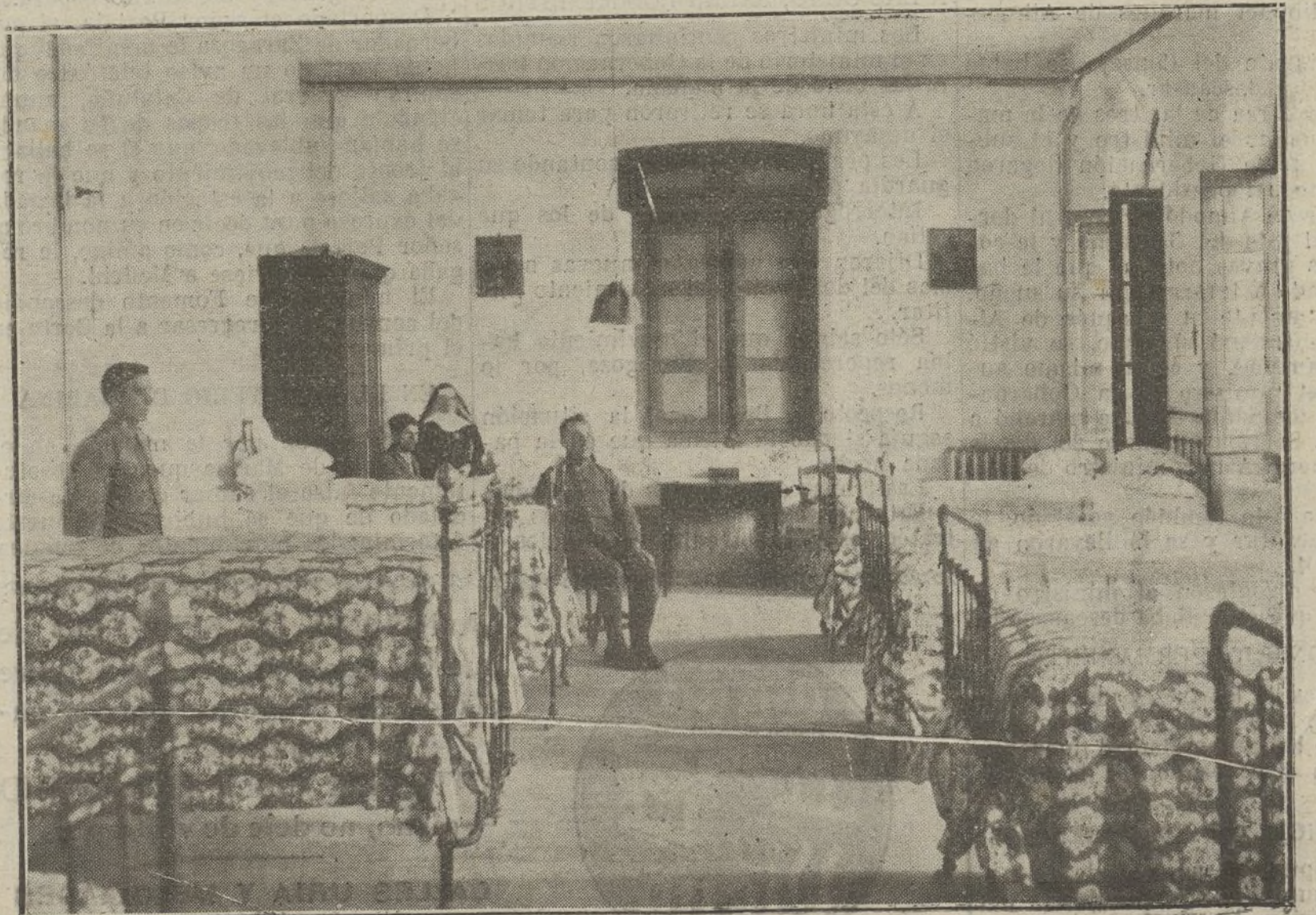
LLANES.—Una sala del Hospital.

La Sociedad de Protección a la Infancia de Chicago ha publicado su Memoria anual, y en ella consigna que durante el año anterior proporcionó cura a 12.000 criaturas. También hace notar que la mortalidad de los recién nacidos, que antes llegaba al 89 por 100, actualmente, y gracias a sus médicos, se ha reducido al 14 por 100.