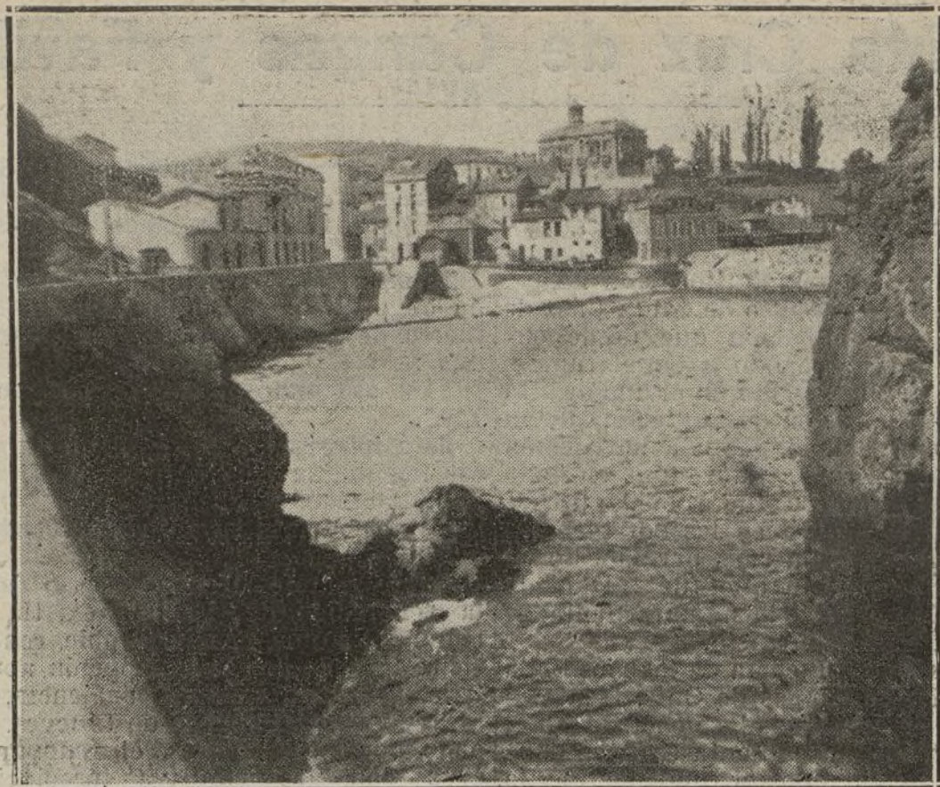
CANDÁS.--Entrada al pueblo, por la carretera de Gijón.

A bordo el Crucifijo por almirante, llenos de fe le aclaman