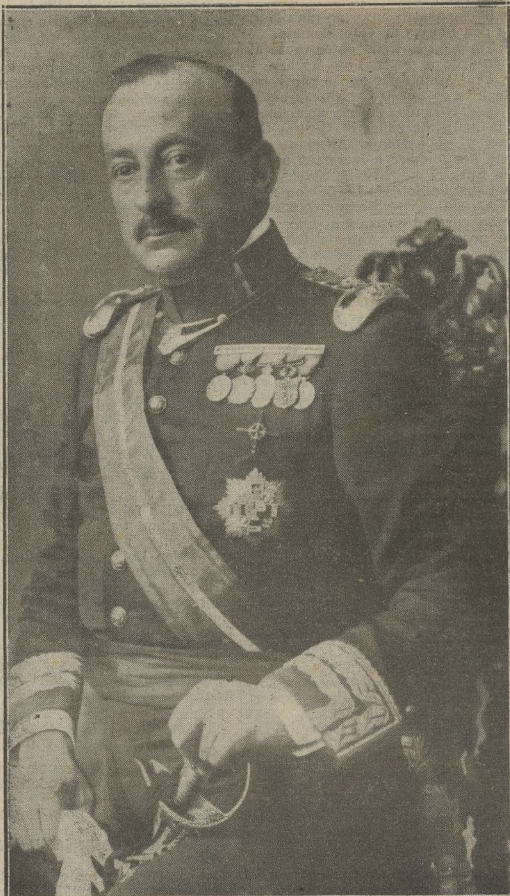
La figura del día.—El general D. Miguel Primo de Rivera, marqués de Estella, que manda las tropas sublevadas en Barcelona.

Si quieres que los demás se solida- ricen contigo cuando te ocurra una gran desgracia, empieza por acom- pañar en sus desgracias al prójimo.