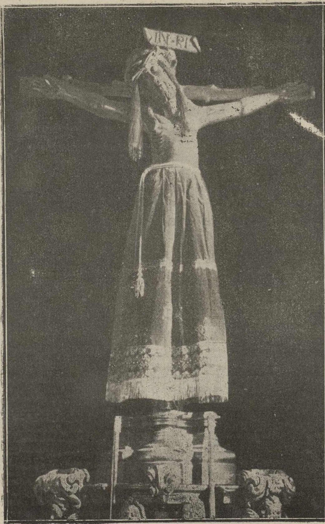
El milagroso Cristo de Candás.