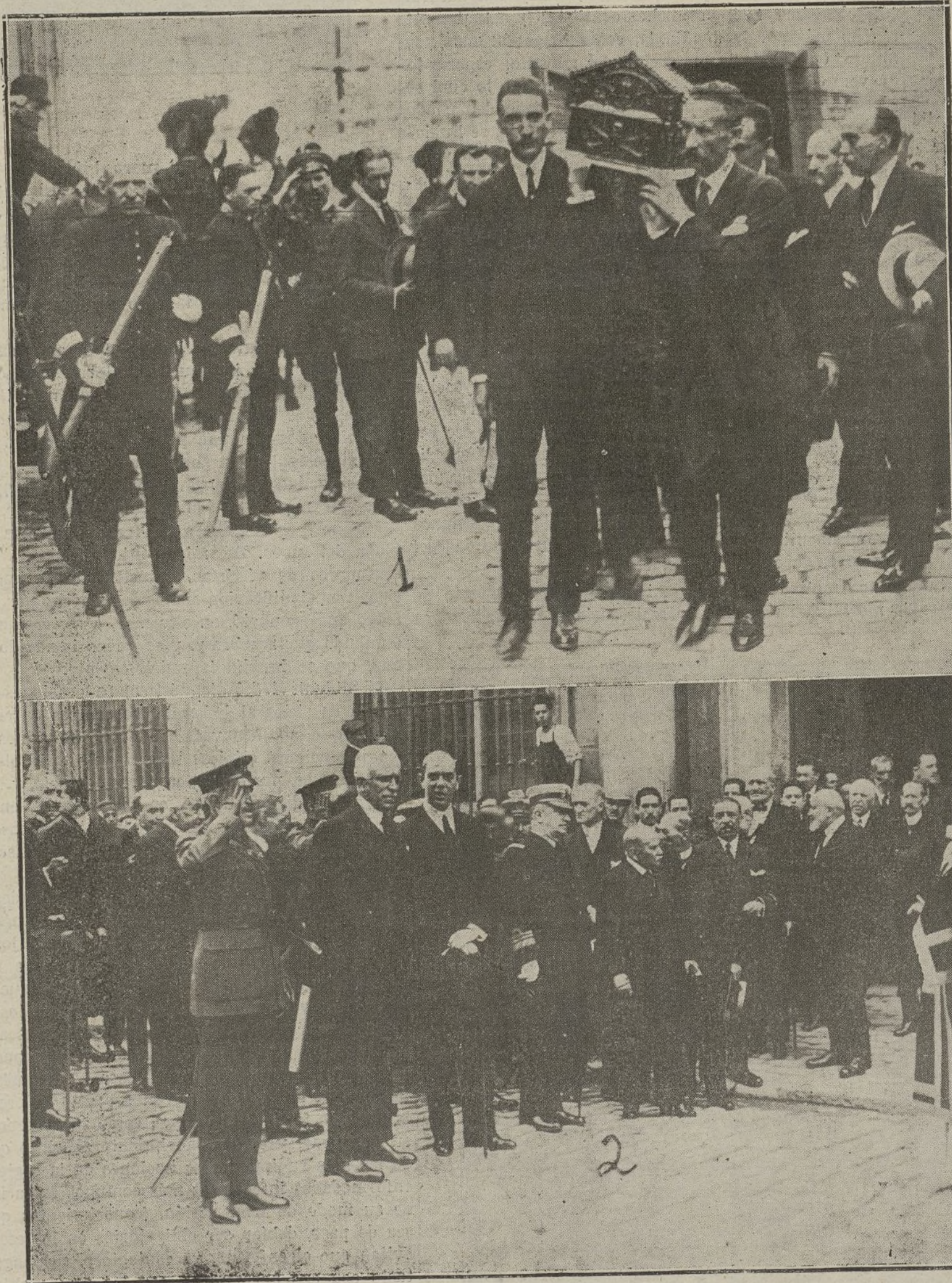
MADRID: Traslado a la estación del Norte de los restos del ilustre patricio D. Nicomedes Pastor Díaz, para su conducción a Galicia.--1. Momento de sacar el féretro del Palacio de Consejos.--2. Los ministros de Instrucción Pública y Fomento, presidiendo el duelo.