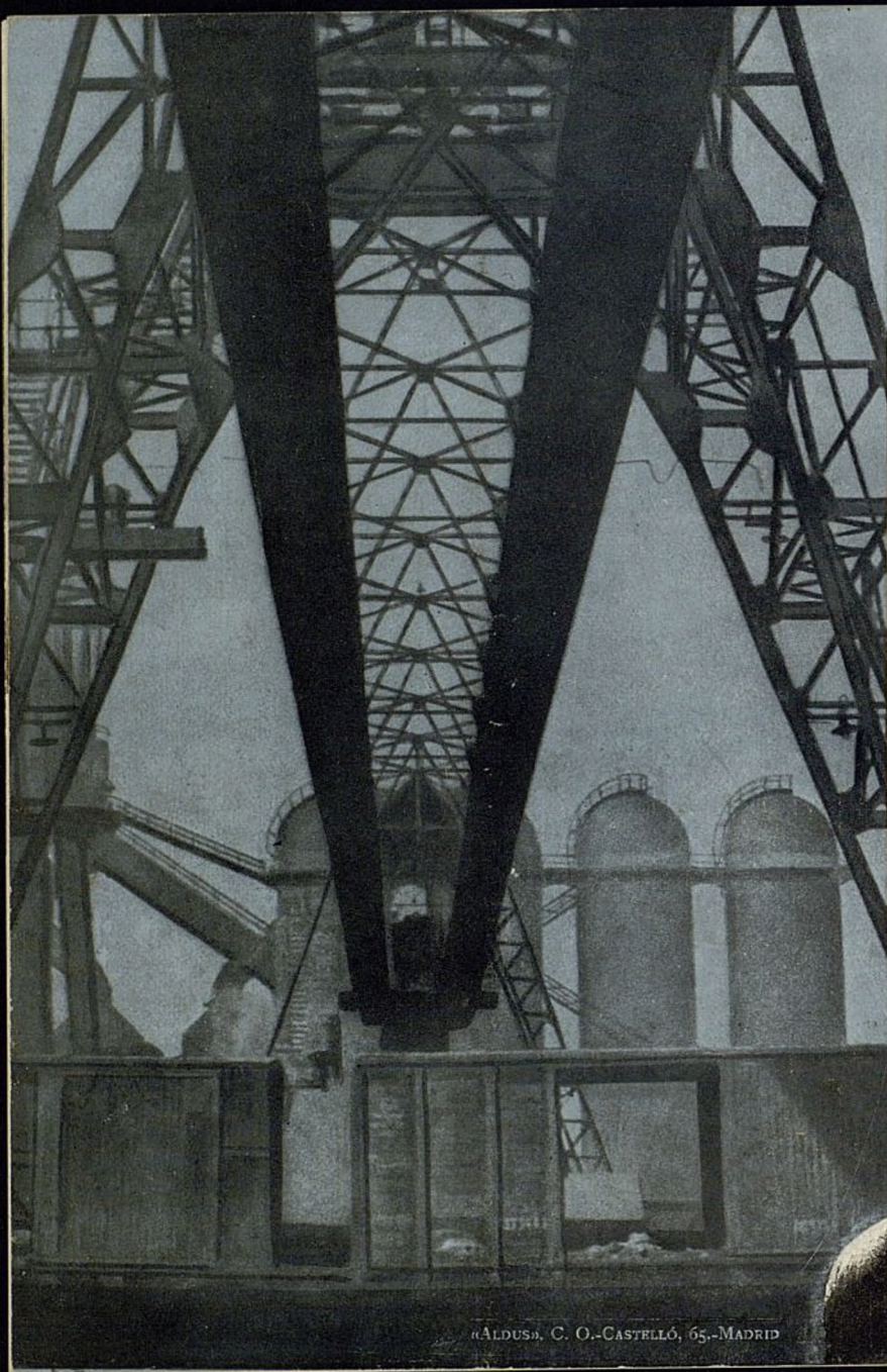
«ALDUS», C. O.-CASTELLÓ, 65.-MADRID