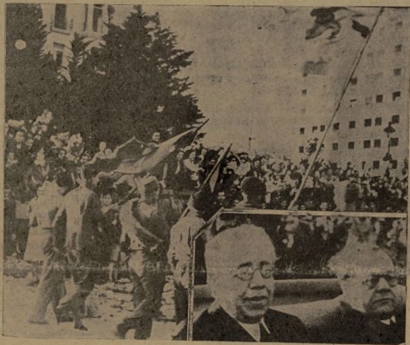
En presencia de Don M. Azaña y Don J. Negrin, desfilan, ovacionados por 300.000 espectadores los valientes milicianos internacionales, momentos antes de marchar de Barcelona.

Al recibir a los que llegan de España, pensamos con el alma henchida de gratitud, que si ellos conservan la ilusión de gozar un triunfo y una reivindicación inponderables, ningún sentimiento podrá superar a la exaltación y a la esperanza con que otros compañeros suyos jugaron sus vidas y las perdieron.