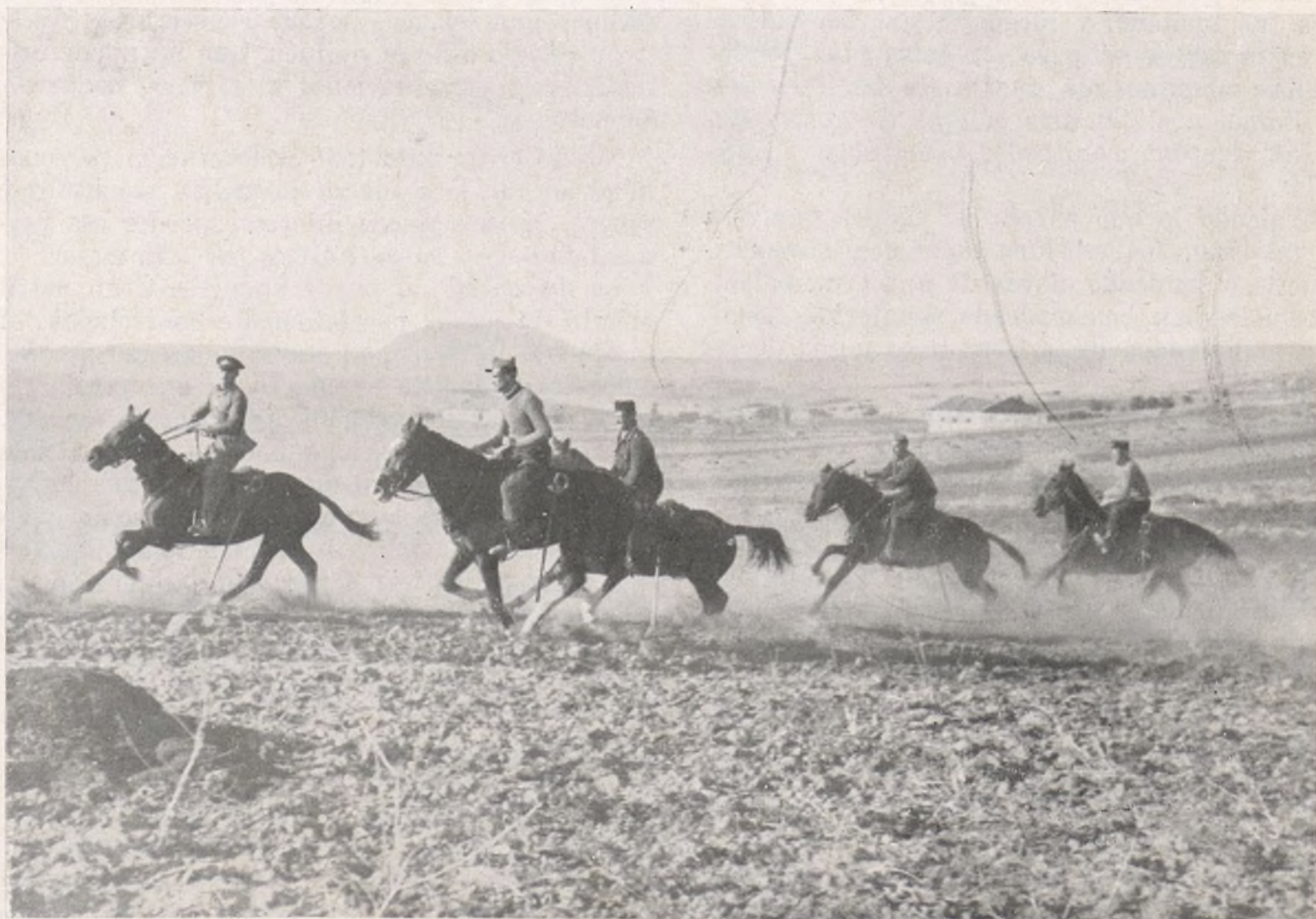
Caballería de nuestra Brigada.