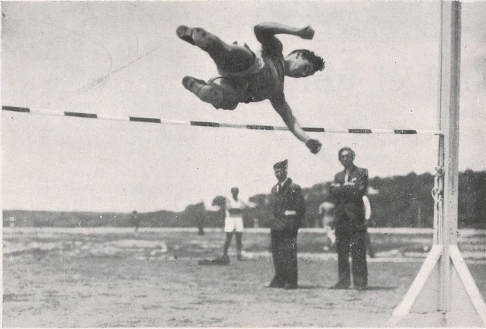
Un soldado del pueblo da un magnífico salto.

de la cabeza con extraordinaria facilidad. Por ejemplo, el músculo externo-cleido-matoideo que tiene su origen en la parte superior del esternón, y que se va a fijar por arriba en el hueso occipital, que es el que está situado en la parte posterior del cráneo tiene como misión principal verificar los movimientos de rotación e inclinación lateral de la cabeza. Cuando el ejercicio se