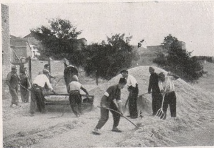
Finalizan los trabajos de las recogidas de las cosechas, y los soldados y campesinos se preparan para emprender otros.