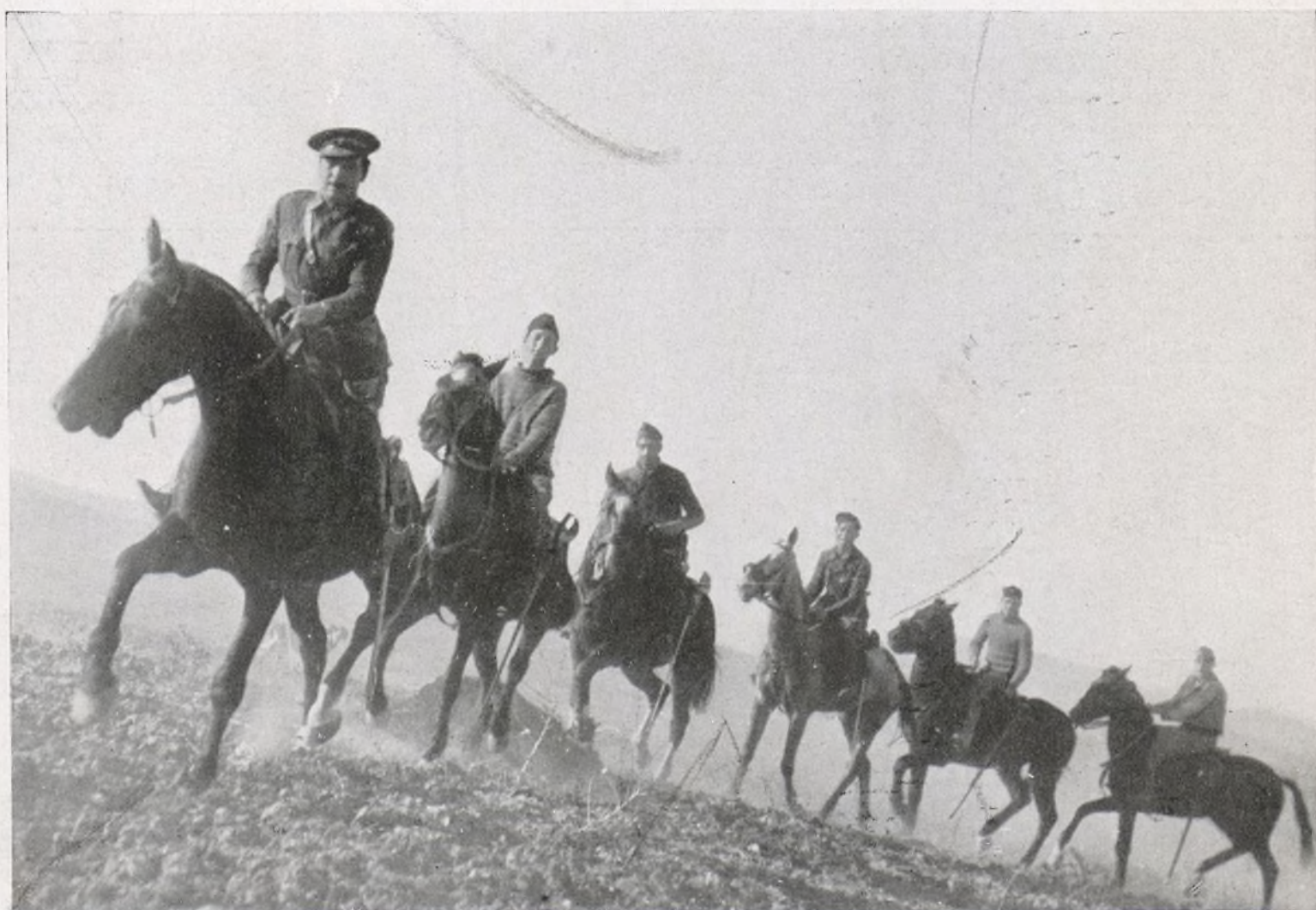
La perfecta formación pone de relieve la gran técnica que hoy predomina en nuestro Ejército.

"Roma y Berlín quieren ganar tiempo—dice L'Oeuvre —. Está claro que al grupo franco-inglés incumbe salir al paso de esta maniobra." "Italia—dice el New York —, apoyada por Alemania y Portugal, ha colocado un obstáculo poco menos que infranqueable en el camino trazado por Francia e Inglaterra." "Todo depende ahora—dice el órgano fascista Le Jour —de averiguar si Grandi pretende reservarse un margen más amplio para seguir regateando." Por su parte, L'Humanité declara que "lo que urge ya no es prolongar la deshonrosa comedia de Londres, sino adoptar las medidas pertinentes para yugular al agresor."